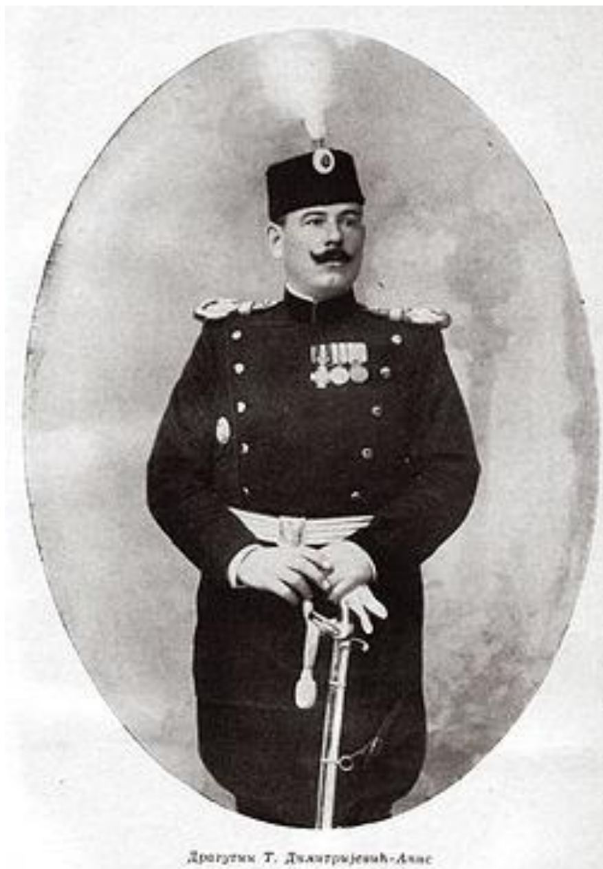
Драгутин Т. Дмитријевич-Апис