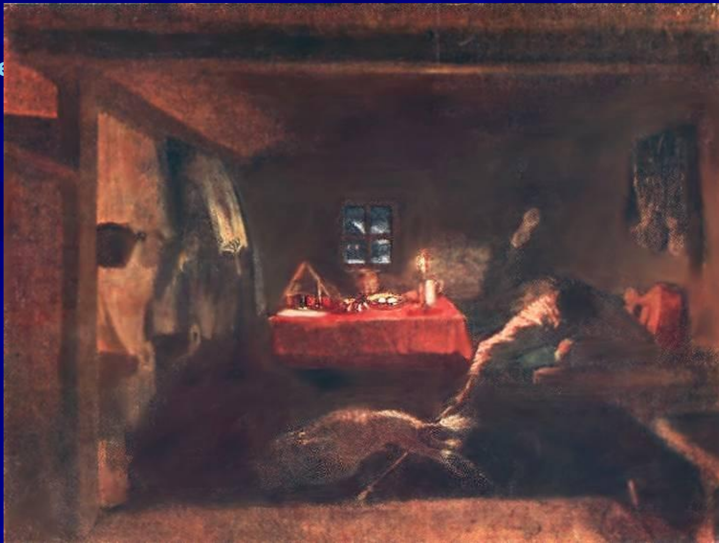
П. Федотов « Анкор, ещё анкор»