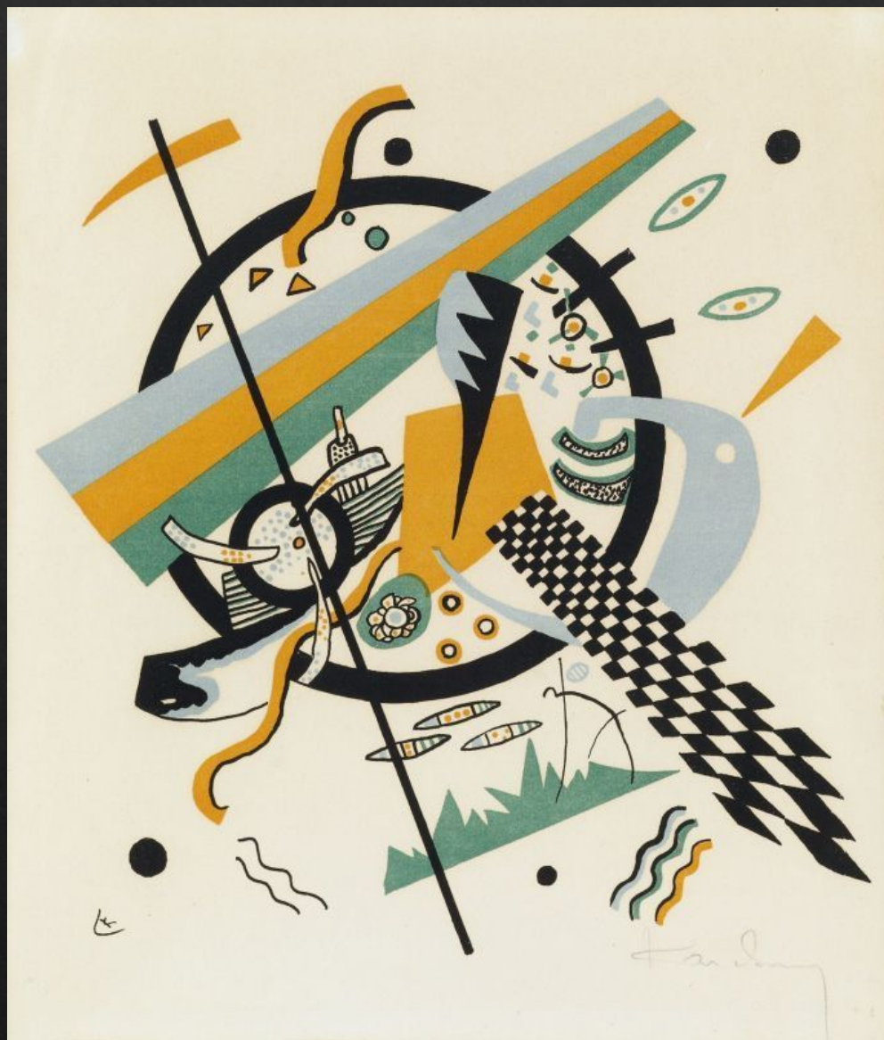
Василий Кандинский «Маленькие миры 4»