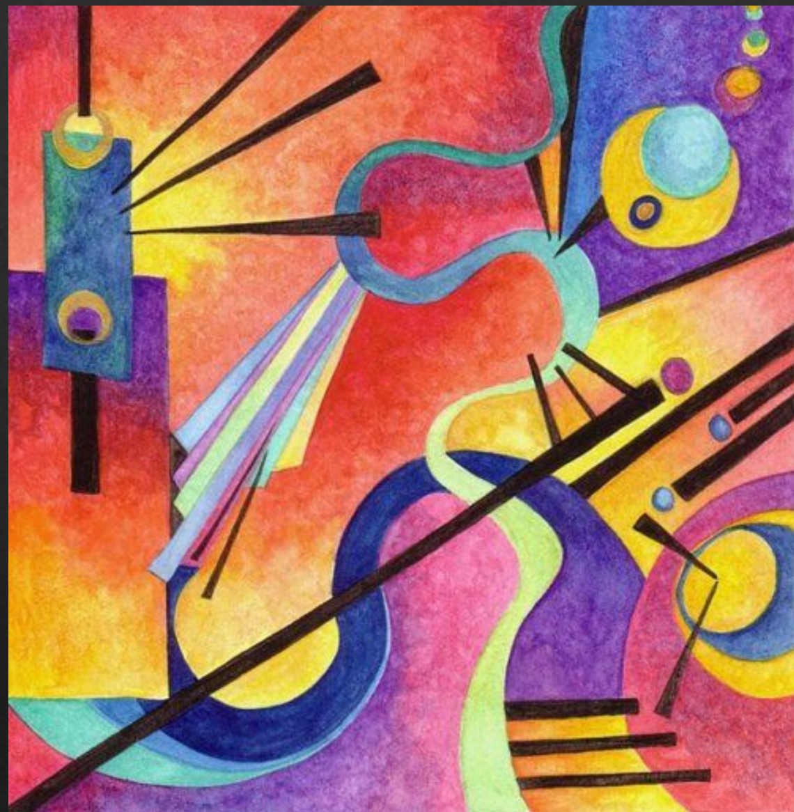
Абстрактная композиция. В.Кандинский.