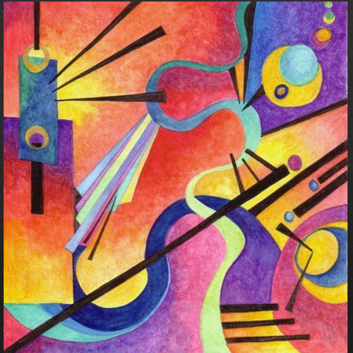
Абстрактная композиция. В.Кандинский.