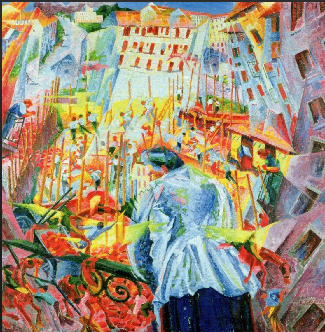
Умберто Боччони "Улица входит дом"