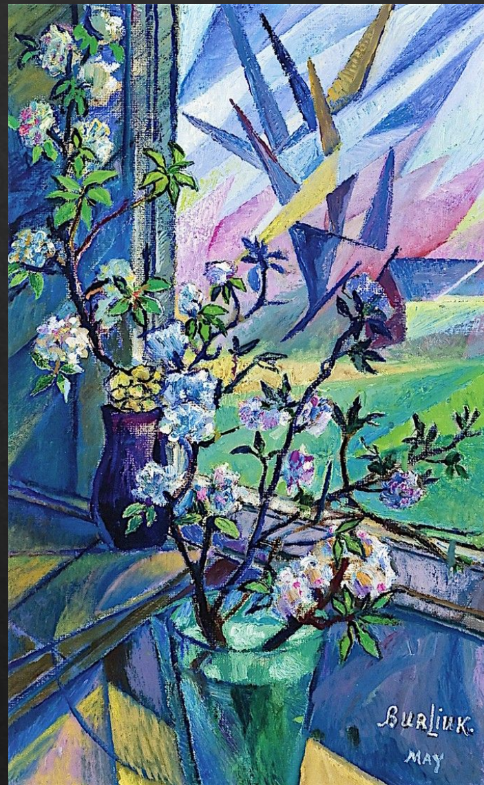
Давид Бурлюк "Цветы с ангелами"