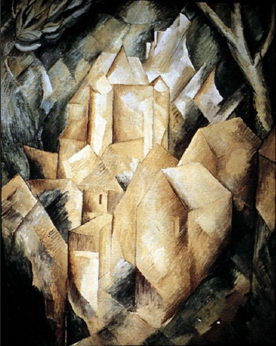
«Дома в Эстраке», Жорж Брак