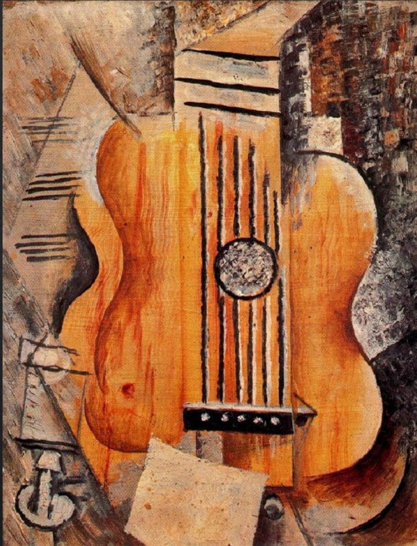
Пабло Пикассо. «Гитара»