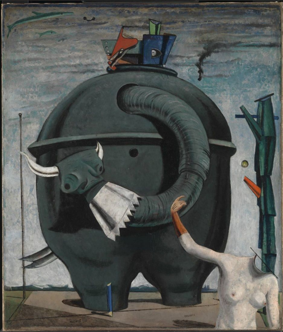
Макс Эрнст. «Слон Целебес»

Общее название новых течений в искусстве, которые полностью отказывались от прежних традиций. Представители модернизма искали новые способы изображения действительности, пытались создать собственное видение мира.