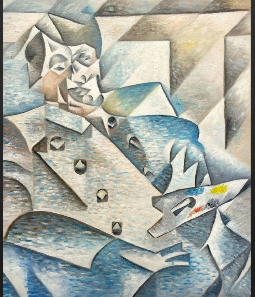
«Портрет Пикассо», Хуан Грис