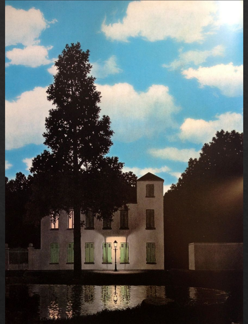
«Империя света». Рене Магритт