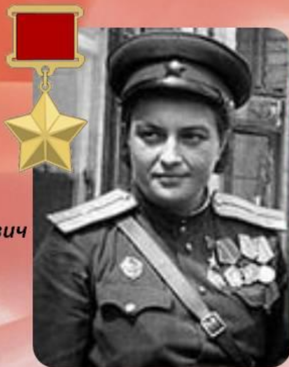
Павличенко Людмила Михайловна