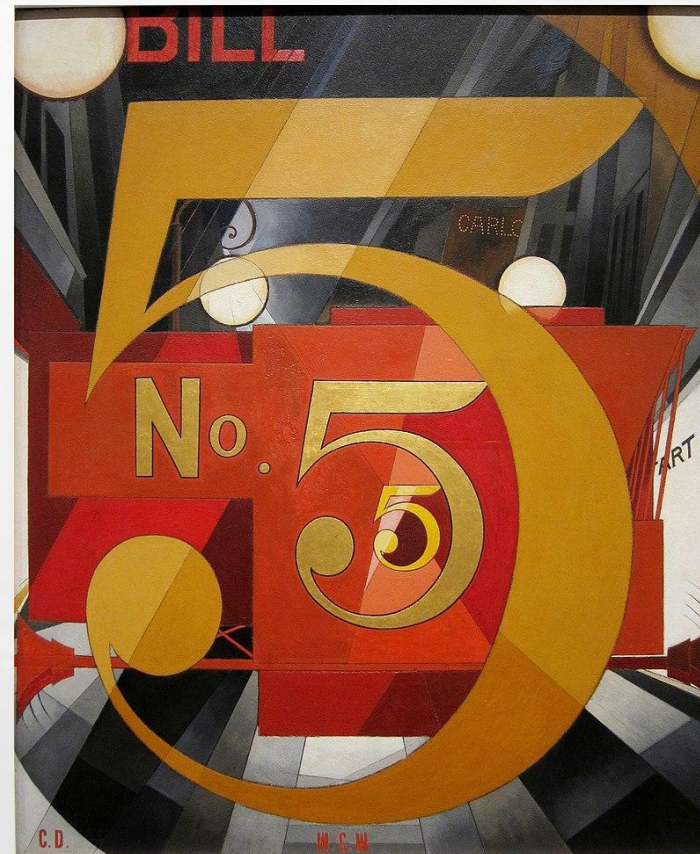
Чарльз Демут, «Я увидел цифру 5 в золоте» (1928). Коллекция Метрополитен-музея, Нью-Йорк

В отличие от США, поп-арт в послевоенной Великобритании, хотя и использовал иронию и пародию, оставался более академичным. Британские художники сфокусировались на динамичных и парадоксальных образах американской поп-культуры как на мощных манипулятивных символах, воздействовавших на стереотипы жизни в целом, одновременно улучшая благосостояние общества. Ранний поп-арт в Британии был полон идей, представляющих собой взгляд со стороны на американскую популярную культуру. Точно так же поп-арт был продолжением и отрицанием дадаизма. Хотя поп-арт и дадаизм использовали одни и те же предметы, поп-арт заменил деструктивные, сатирические и анархические импульсы движения Дада самостоятельным утверждением артефактов массовой культуры. Среди европейских художников, создававших произведения поп-арта, такие артисты, как Пабло Пикассо, Марсель Дюшан и Курт Швиттерс.