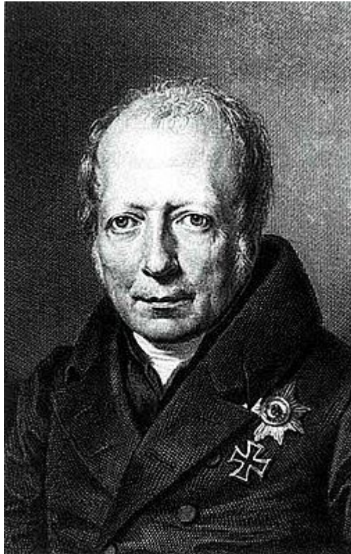
Вильгельм фон Гумбольдт 1767 - 1835