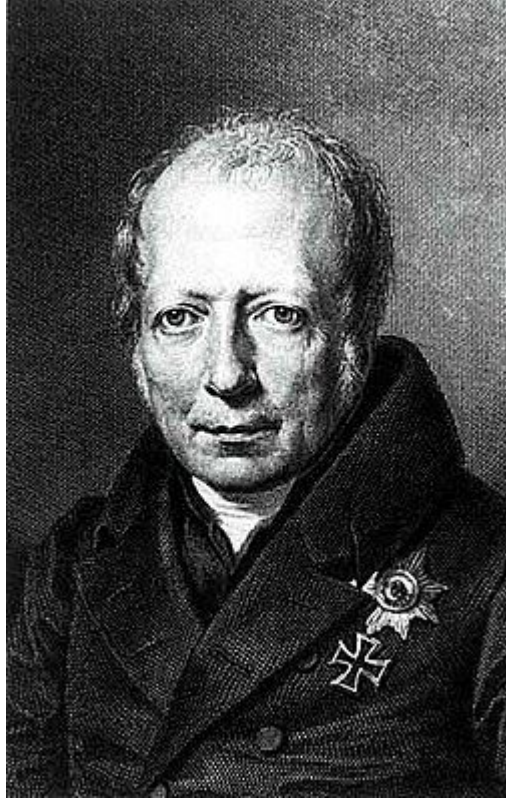
Вильгельм фон Гумбольдт 1767 - 1835