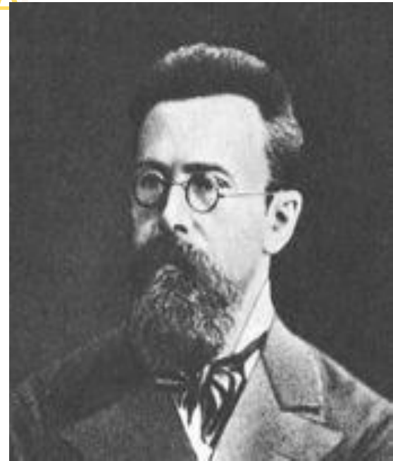
Н. А. Римский-Корсаков