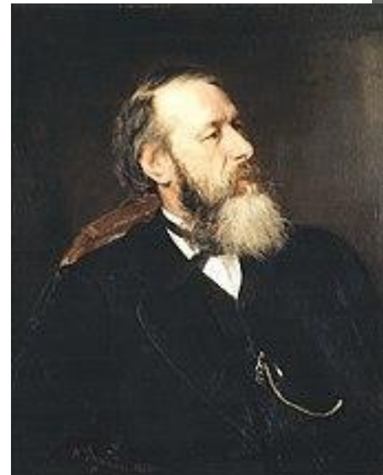
В. В. Стасов, портрет кисти И. Репина (1873)

В феврале-марте 1874 года в Императорской академии художеств по инициативе Стасова и при содействии Петербургского общества архитекторов была проведена посмертная выставка из около 400 работ Гартмана, созданных за 15 лет, — рисунков, акварелей, архитектурных проектов, эскизов театральных декораций и костюмов, эскизов художественных изделий.