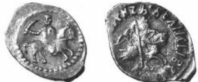
Монеты XV–XVI вв.