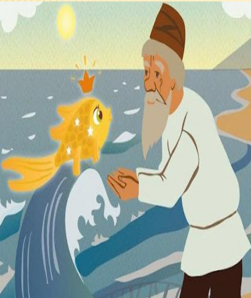
« Сказка о рыбаке и рыбке»