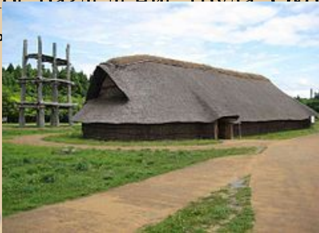
стоянка Саннай-Маруяма (г. Аомори, преф. Аомори, V в. до н. э., 100-200 чел.)