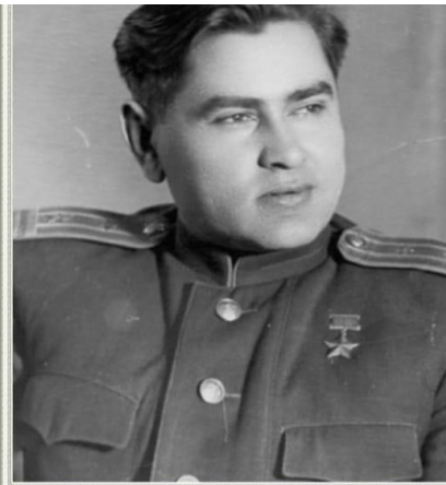
МАРЕСЬЕВ Алексей Петрович