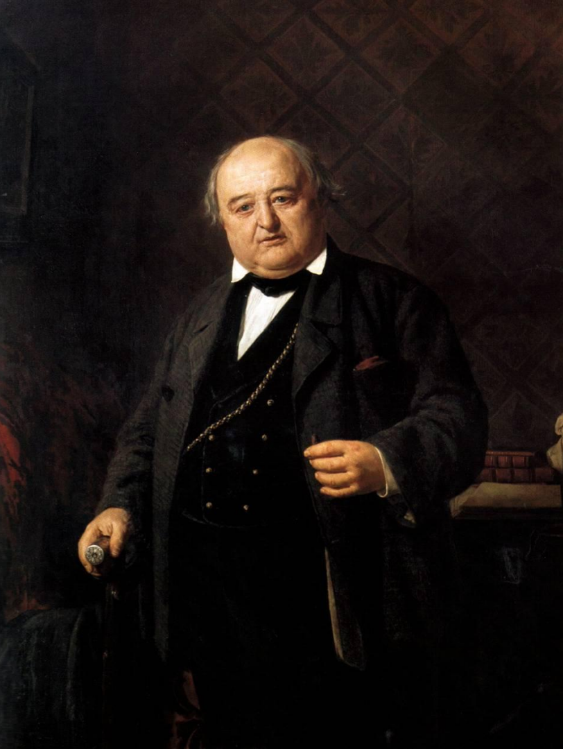
Михаил Семёнович Щепкин (1788–1863 гг.)