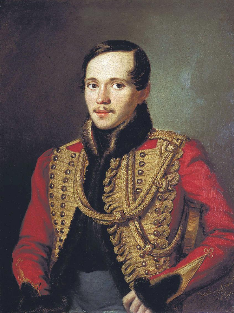
М.Ю. Лермонтов «Герой нашего времени»