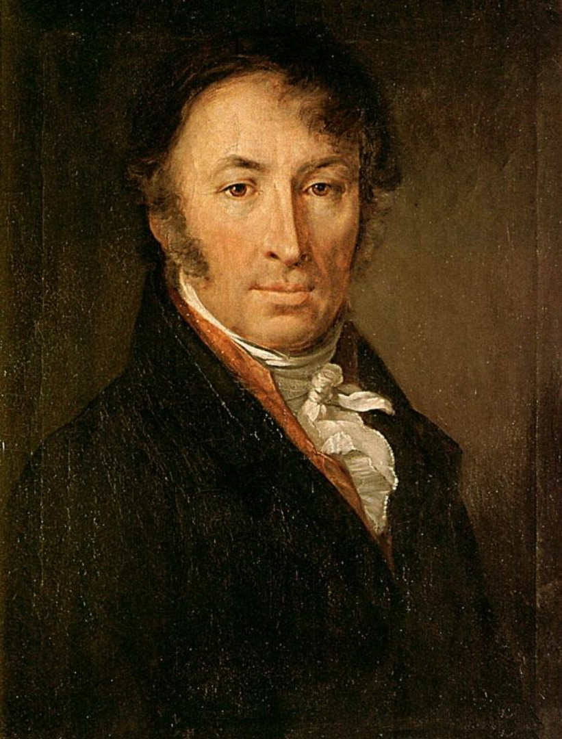
Николай Михайлович Карамзин «Марфа Посадница, или Покорение Новгорода» (1803 г.)