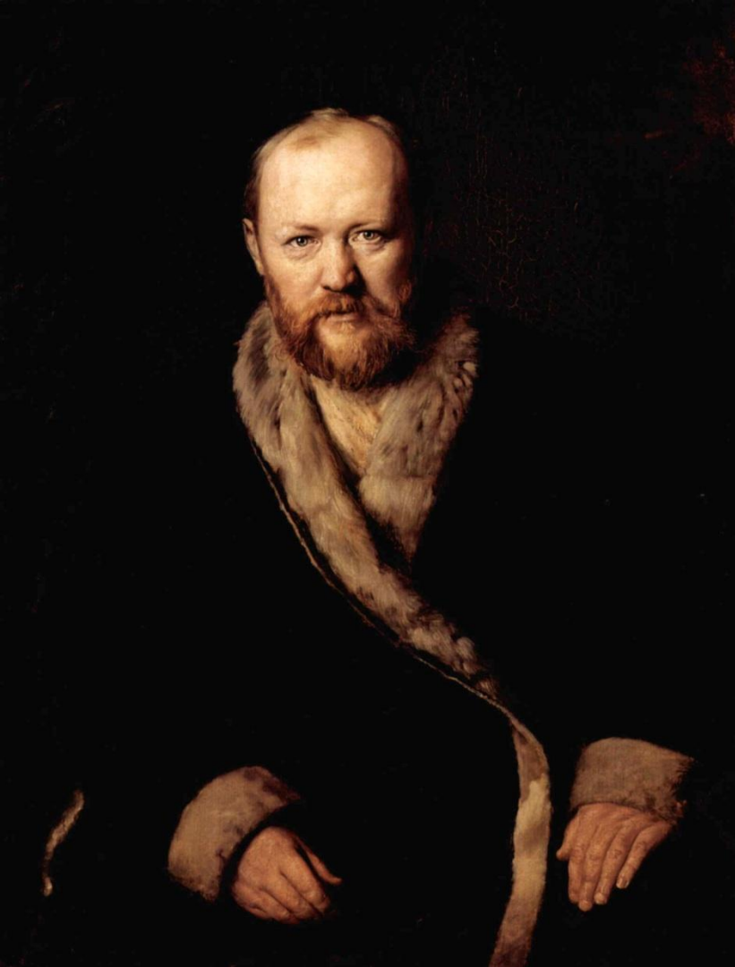
Александр Николаевич Островский «Свои люди — сочтёмся» (1849 г.)