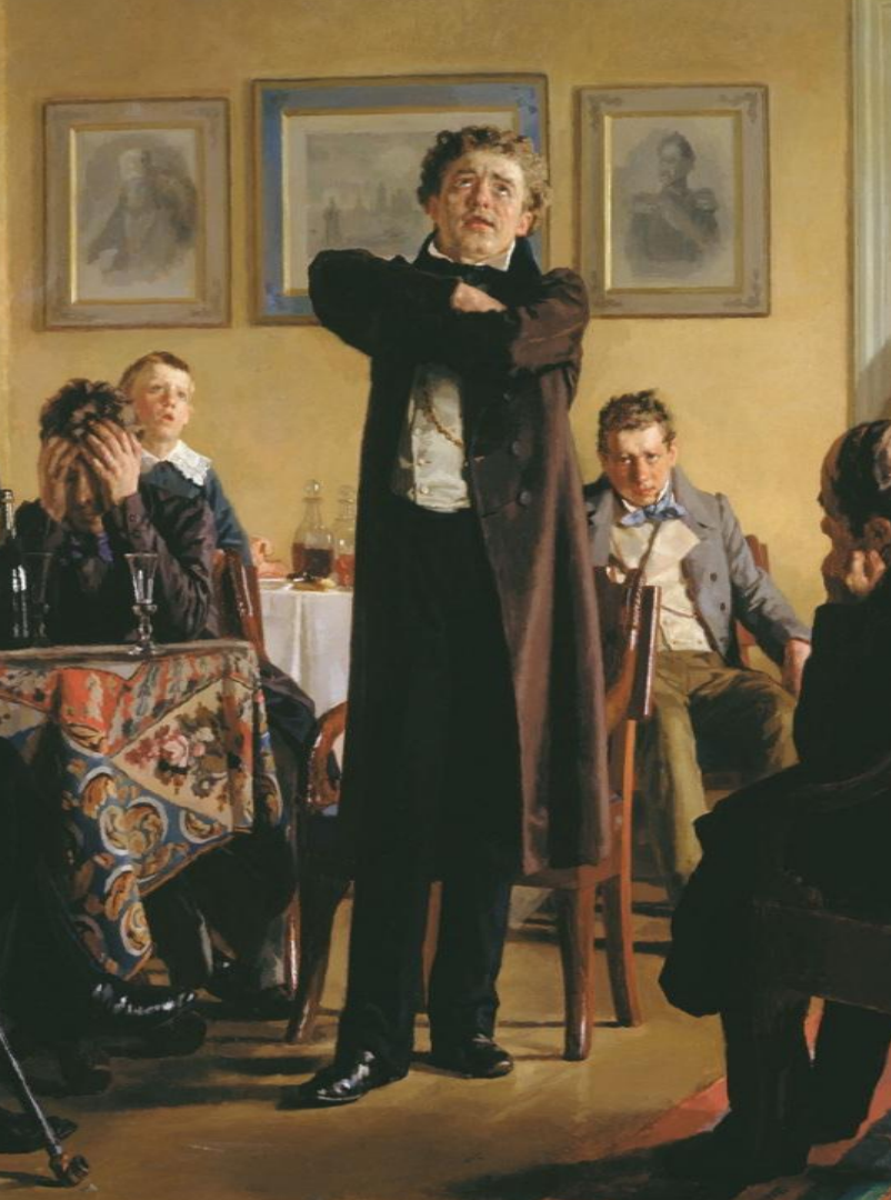
Павел Степанович Мочалов (1800–1848 гг.)