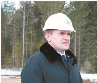
Закладка камня Устьянского ЛПК, 2008 год