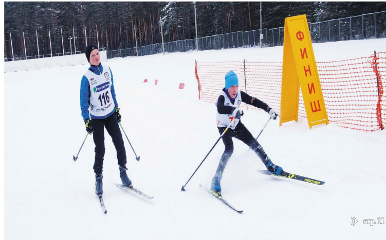
» стр. 11