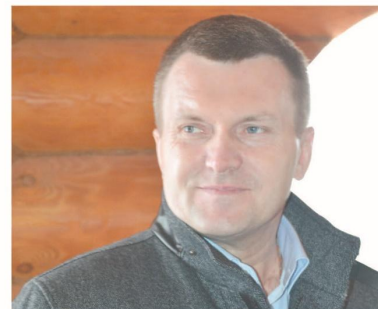
Мысли, полные планов, 2016 год