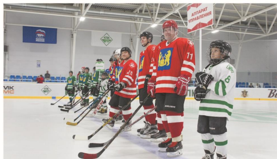
Позитивный настрой на матч, 2019 год