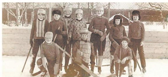
Первая хоккейная команда, школьные годы