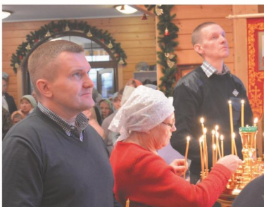
Молитва – крепость для души, 2020 год