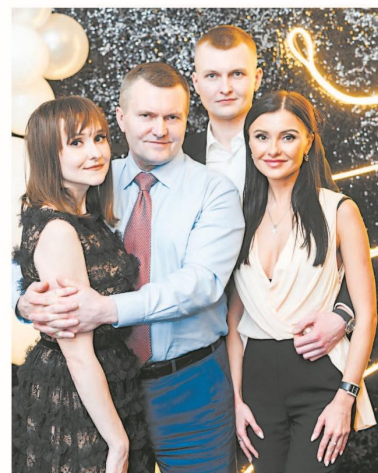
В окружении старших детей, 2020 год