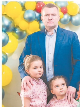
Папины дочки, 2020 год