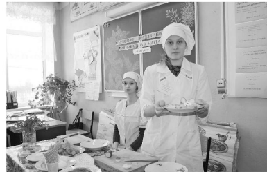
Елизавета ПЕТРОВА

Окончание. Начало в № 3, 4, 5 от 23 января и 4, 11 февраля 2021 года.