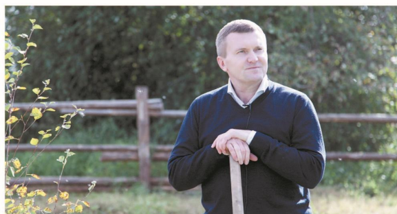
Размышляя о будущем, 2015 год