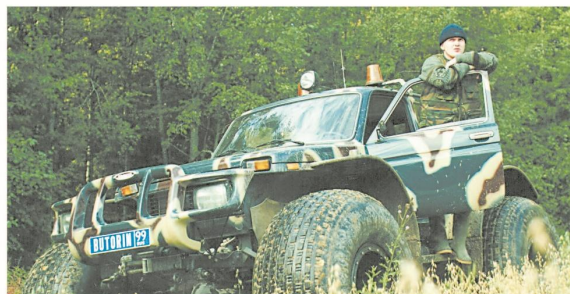
Хозяин тайги, начало 2000-х