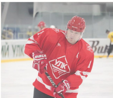
Капитан на льду, 2018 год