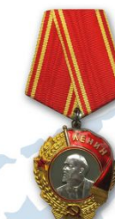
Орден Ленина – более 5 500 тружеников тыла