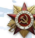
Орден Отечественной войны 1 и 2 степени