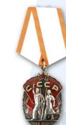
Орден «Знак Почета» – 66 107 человек