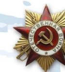
Орден Отечественной войны 1 и 2 степени