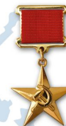
Звезда Героя Социалистического Труда – 198 человек

Из Федерального закона от 1 марта 2020 г. № 41 ФЗ «О почетном звании Российской Федерации «Город трудовой доблести»