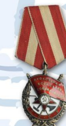
Орден Красного Знамени