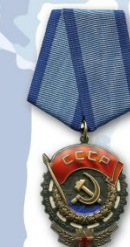
Орден Трудового Красного Знамени – 21 751 человек