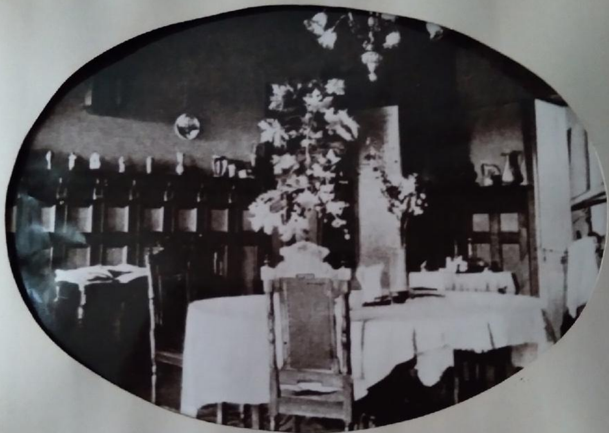
ИНТЕРЬЕР СТОЛОВОЙ НАЧАЛА XX ВЕКА