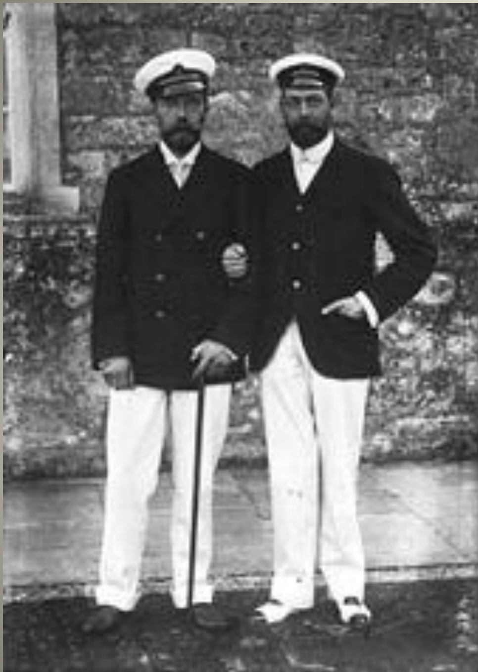
Николай II и его кузен английский король Георг V