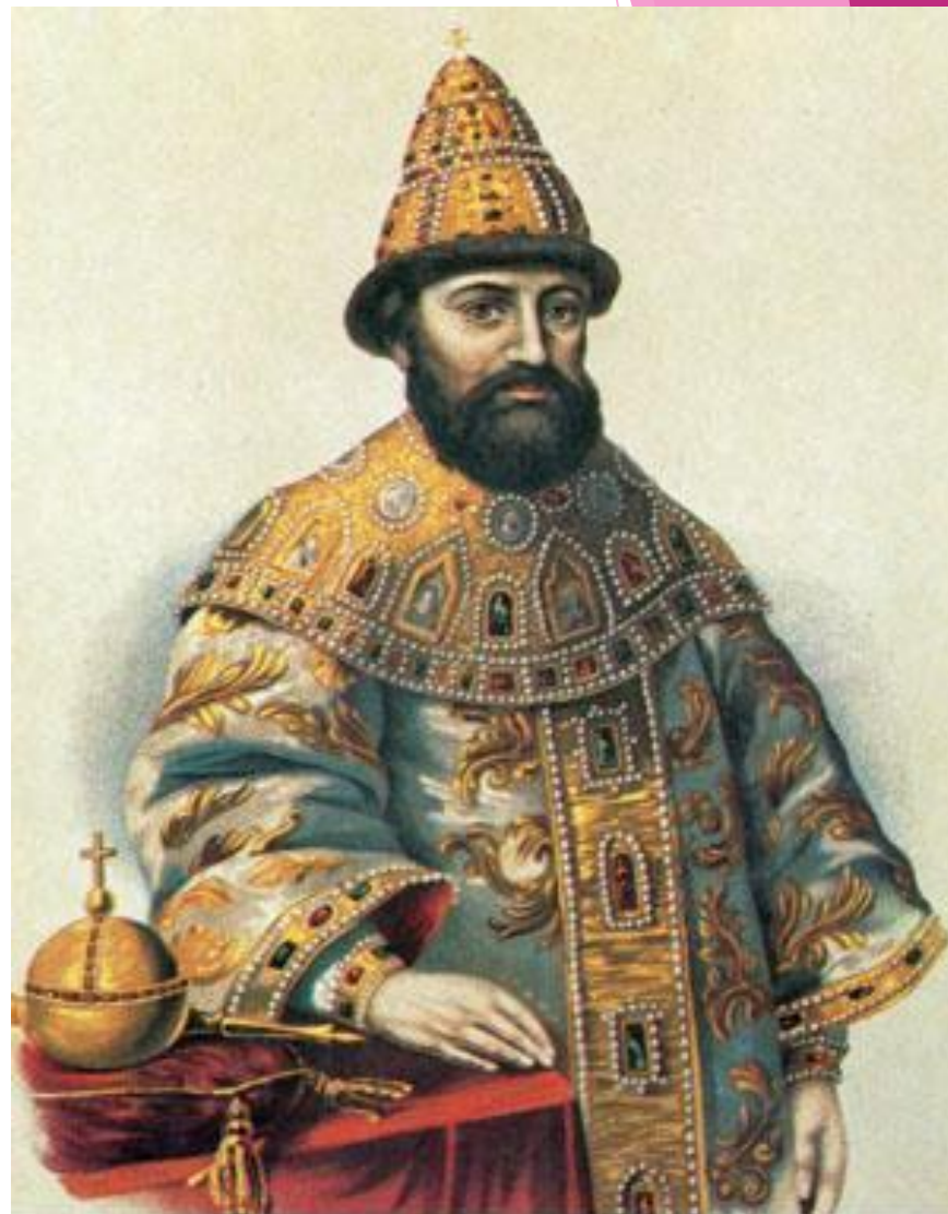
Михаил Федорович (1596-1645)

11 июня 1613 года Михаил Федорович Романов венчался на царство.