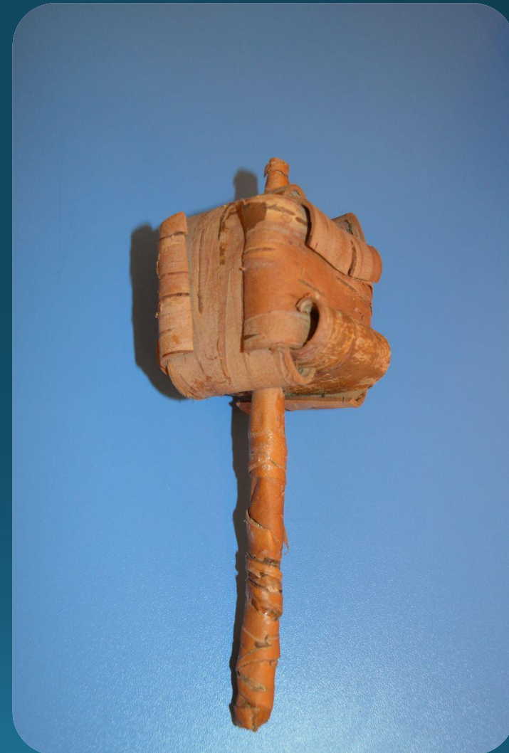
Погремушка ( Шур-шар).

Этим и инструментом забавляли маленьких детей. Почему так народ назвал этот инструмент? Потому что он шуршит.