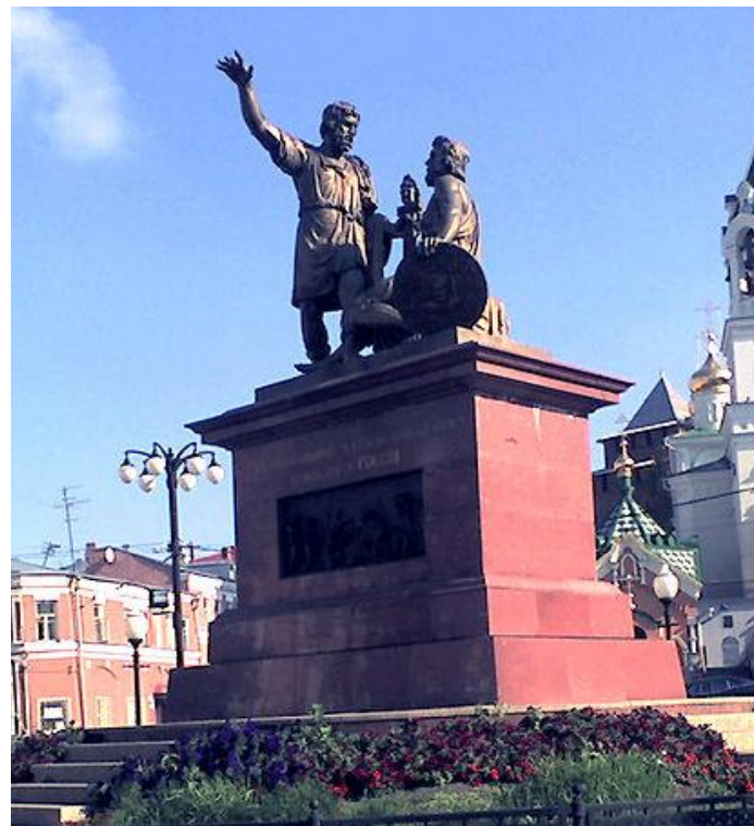
Памятник Минину и Пожарскому в Нижнем Новгороде