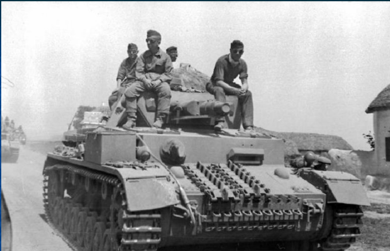
Наступление немецких войск.