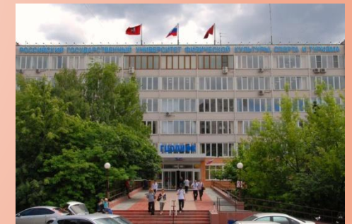
РГУФКСМ и Т