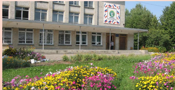
Оршанский многопрофильный колледж им. И. К. Глушкова