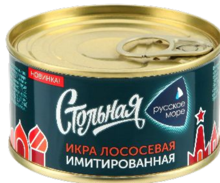
Икра лососевая имитированная Стольная 120г

Жестяная банка - традиционная узнаваемая упаковка для икры, ассоциирующаяся с праздником и застольем.