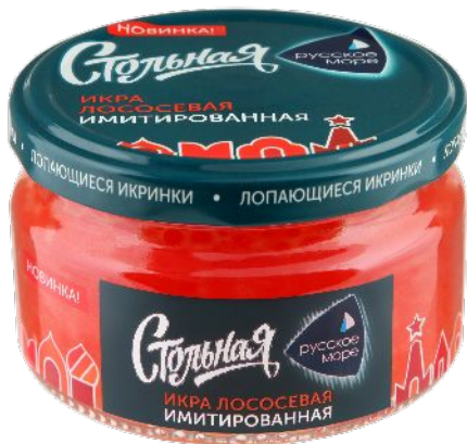
Икра лососевая имитированная Стольная 200г