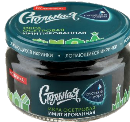
Икра осетровая имитированная Стольная 200г