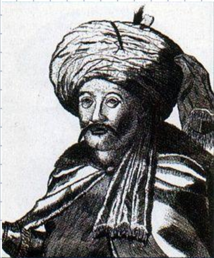
Шагин-Гирей и Суворов