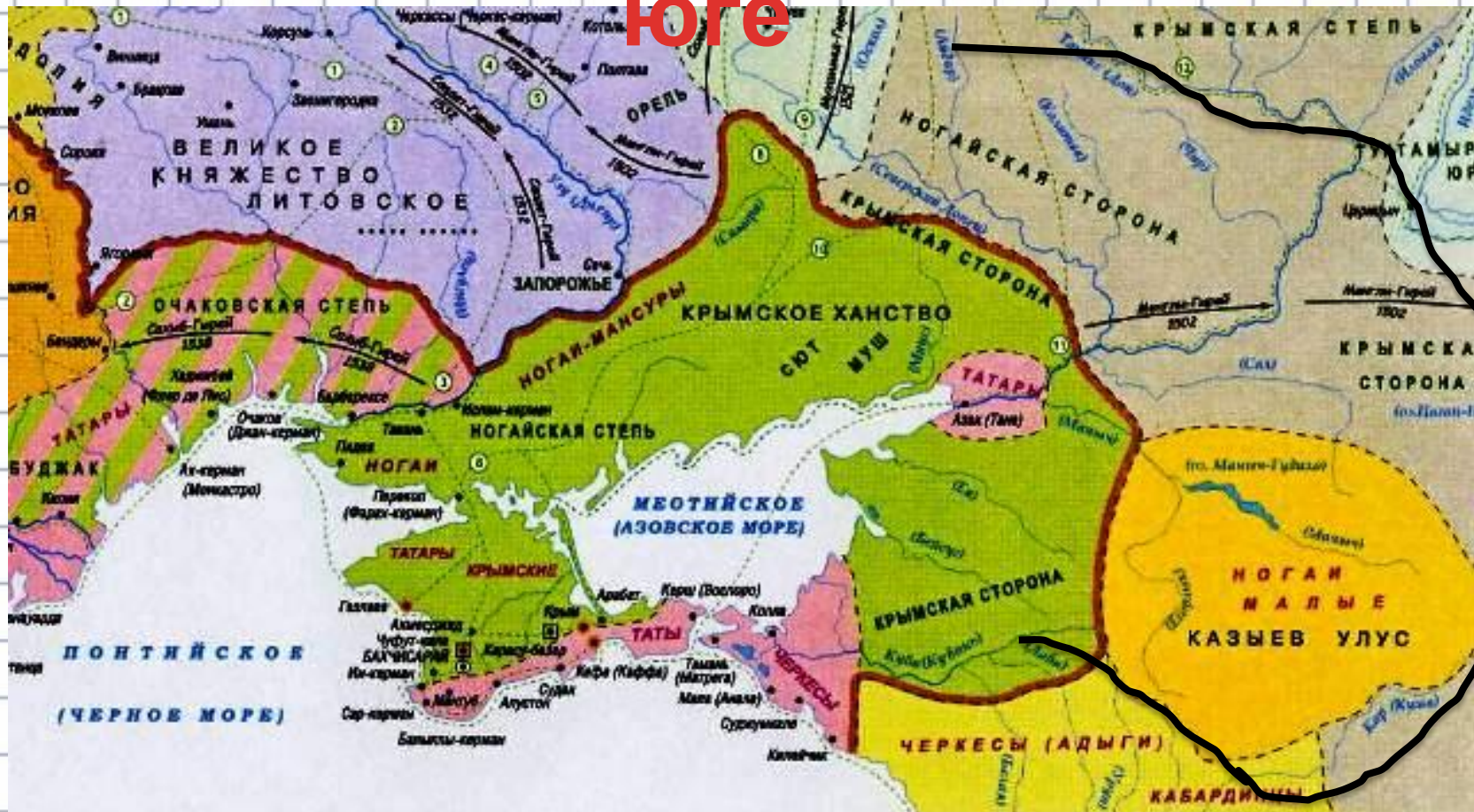
Автор карты А.А. Астейкин