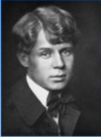
Сергей Александрович Есенин.