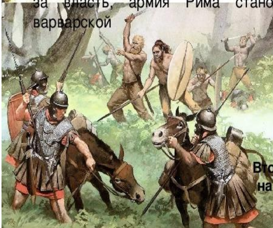
Вторжение германцев на территорию Рима.