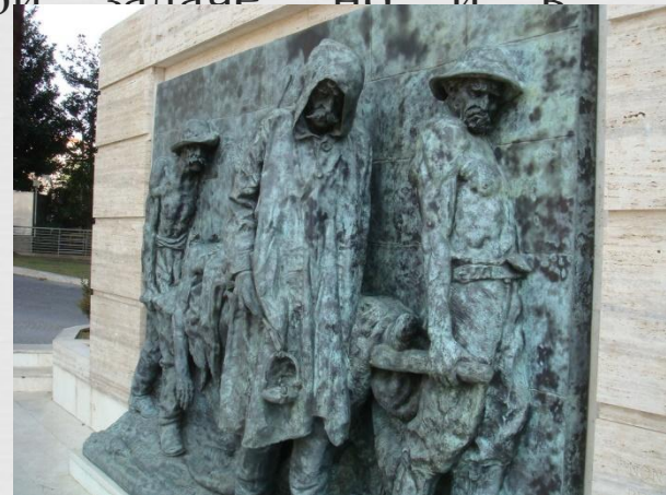
Винченцо Вела «Жертвы труда»