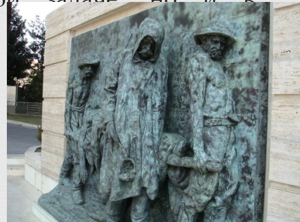
Винченцо Вела «Жертвы труда»