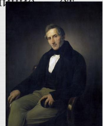
Франческо Хайец портрет Алессандро Манцони