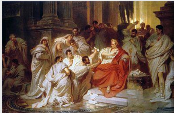
Андреа Аппиани «Смерть Юлия Цезаря»