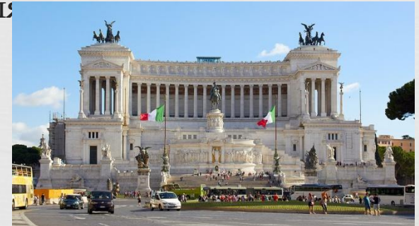
памятник Виктору Эммануилу в Риме