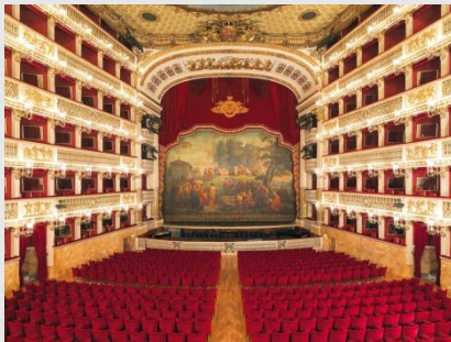
Антонио Никколини театр Сан Карло