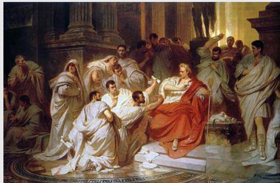
Андреа Аппиани «Смерть Юлия Цезаря»