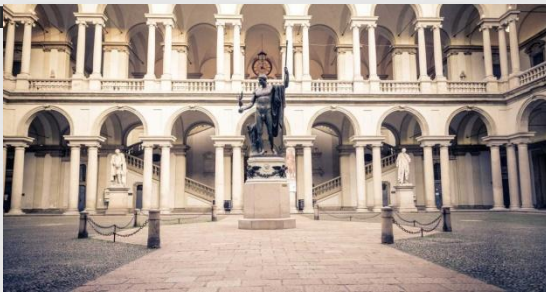
Винченцо Вела статуя Спартака, разрывающего цепи