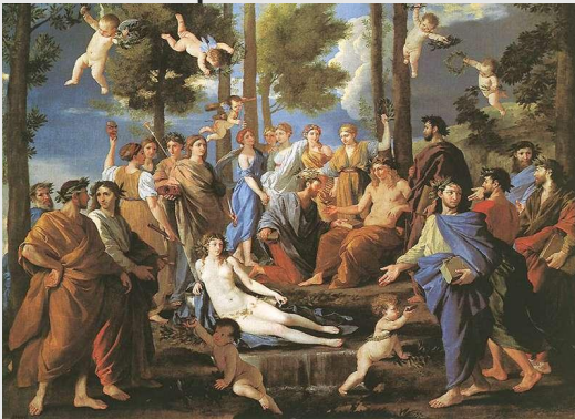
Андреа Аппиани «Аполлон на Парнасе среди муз»