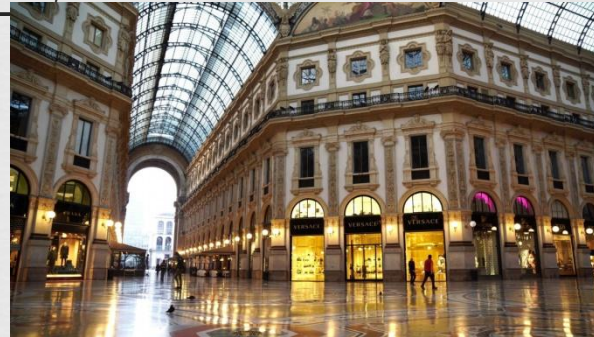
галлрея Виктора Эммануила