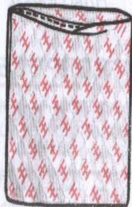
в С клапаном