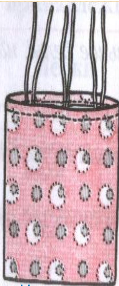
б На завязках