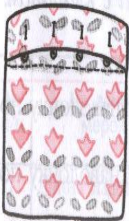
а На пуговицах