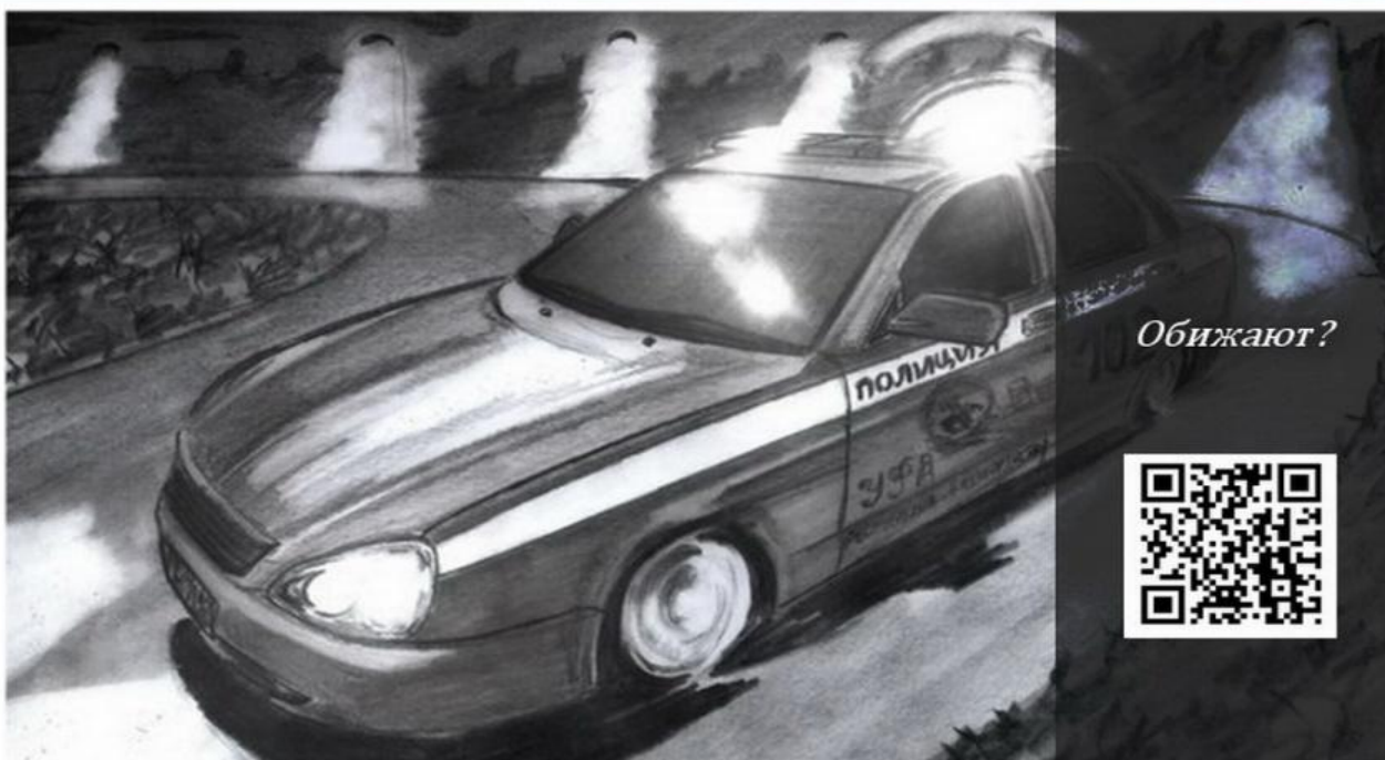
Образец: рисунок + QR-код