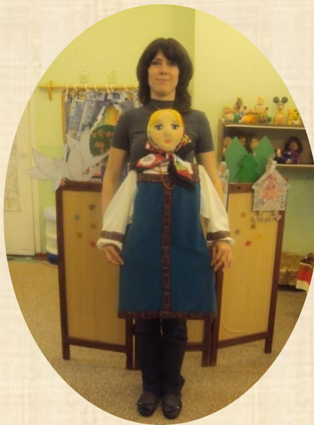
КУКЛА «С ЖИВОЙ РУКОЙ»