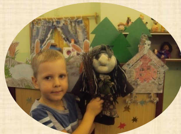
КУКЛА НА ГАПИТЕ