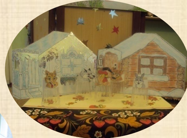
КОНУСНАЯ КУКЛА - КАРТОНАЖ