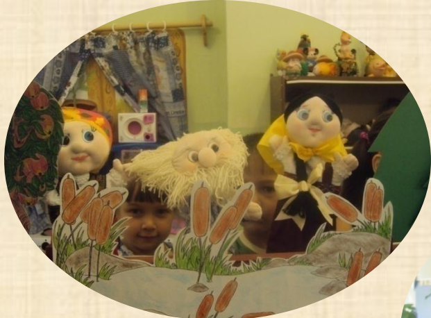
КУКЛА - ПЕРЧАТКА