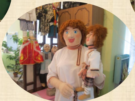
РОСТОВАЯ КУКЛА И КУКЛА - КАРМАШЕК