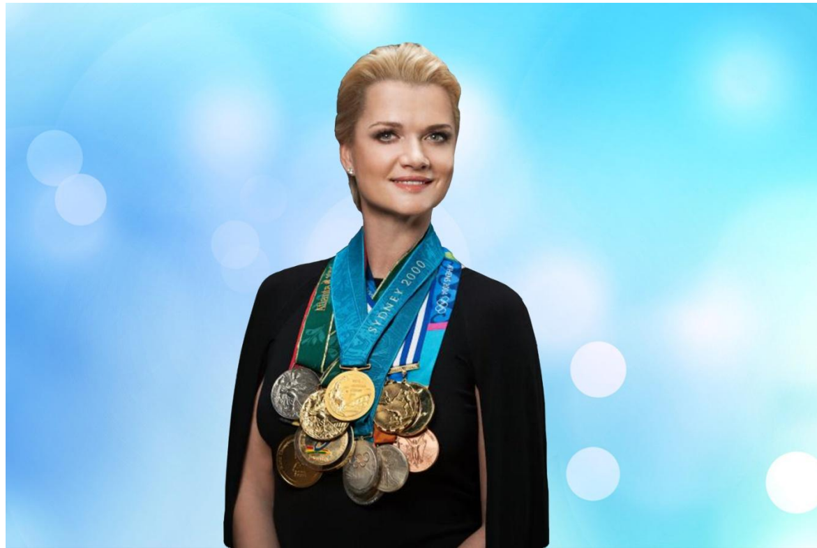
Светлана Хоркина гимнастка