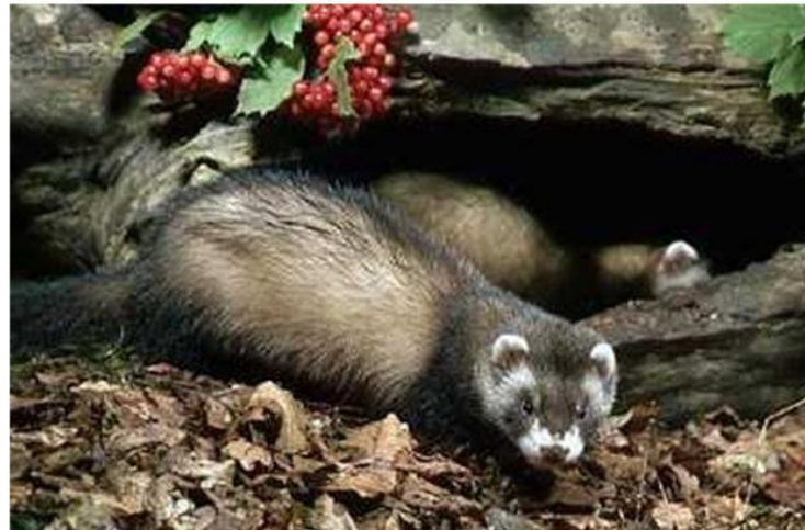
2 Лесной хорек