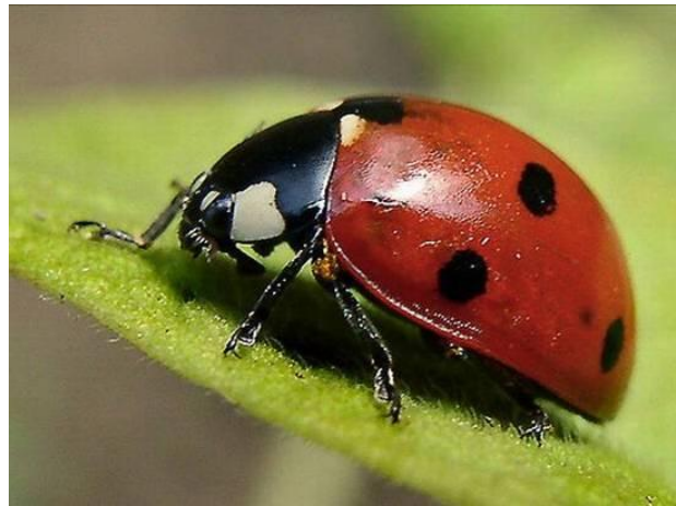
2 Божья коровка