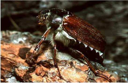
1 Майский жук