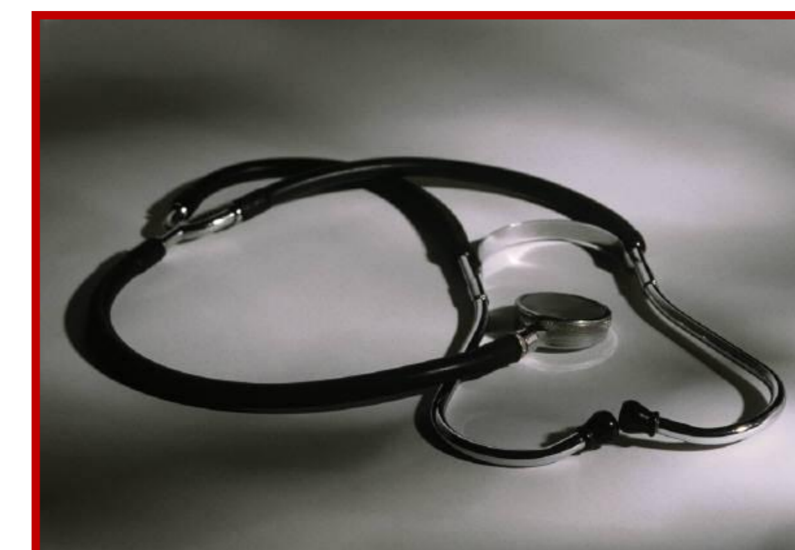
Рис 1. Название рисунка 1