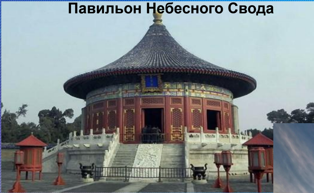
Павильон Небесного Свода