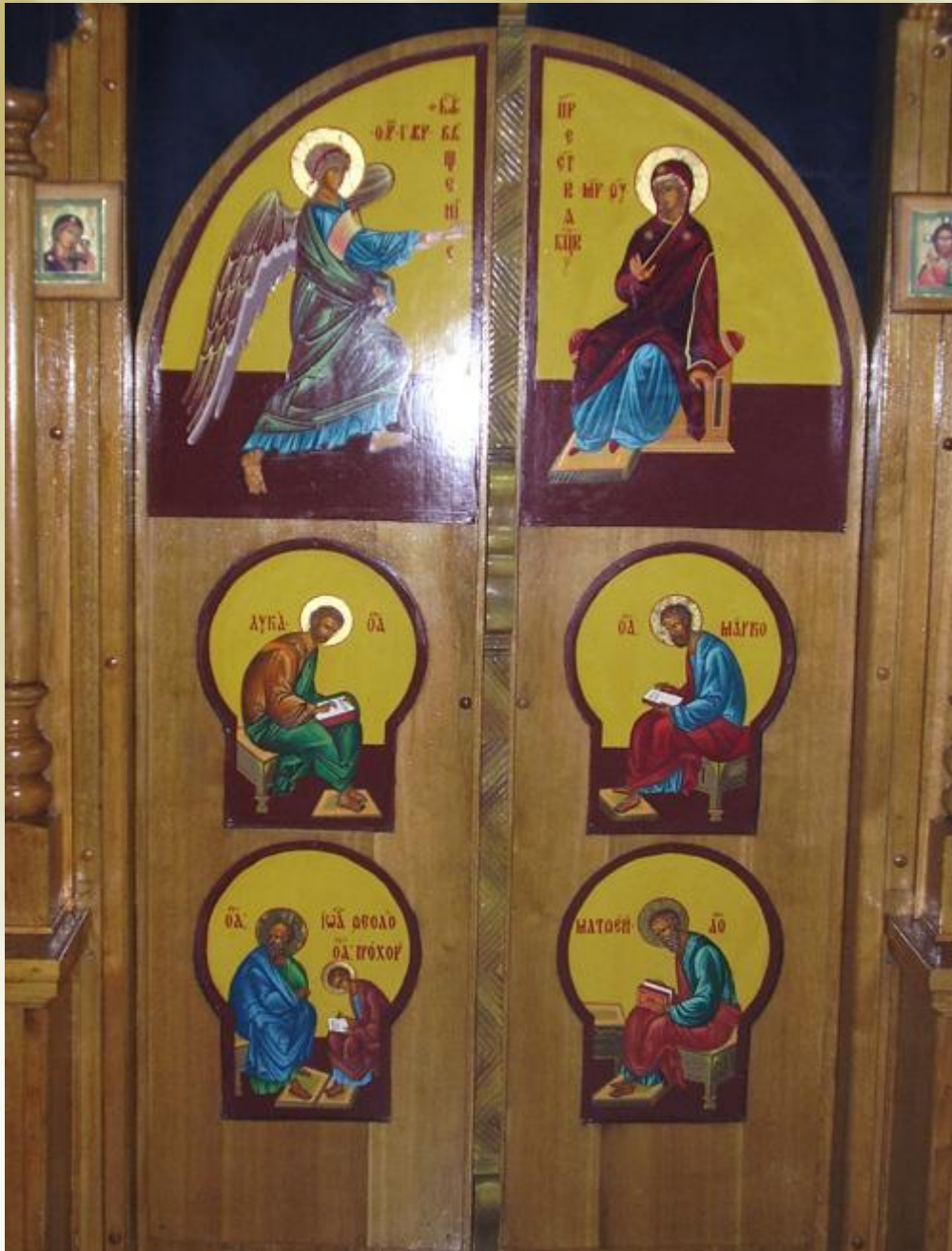
Изображение евангелистов на царских вратах иконостаса