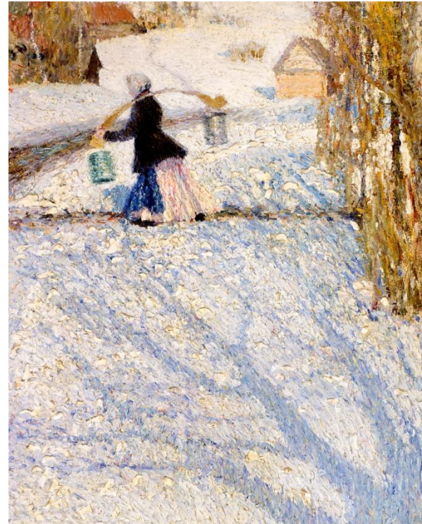
Грабарь. Мартовский снег. 1904