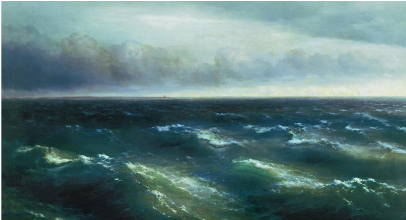
Айвазовский. Черное море. 1894.

-создание новых по замыслу культурных, материальных ценностей (вещей)