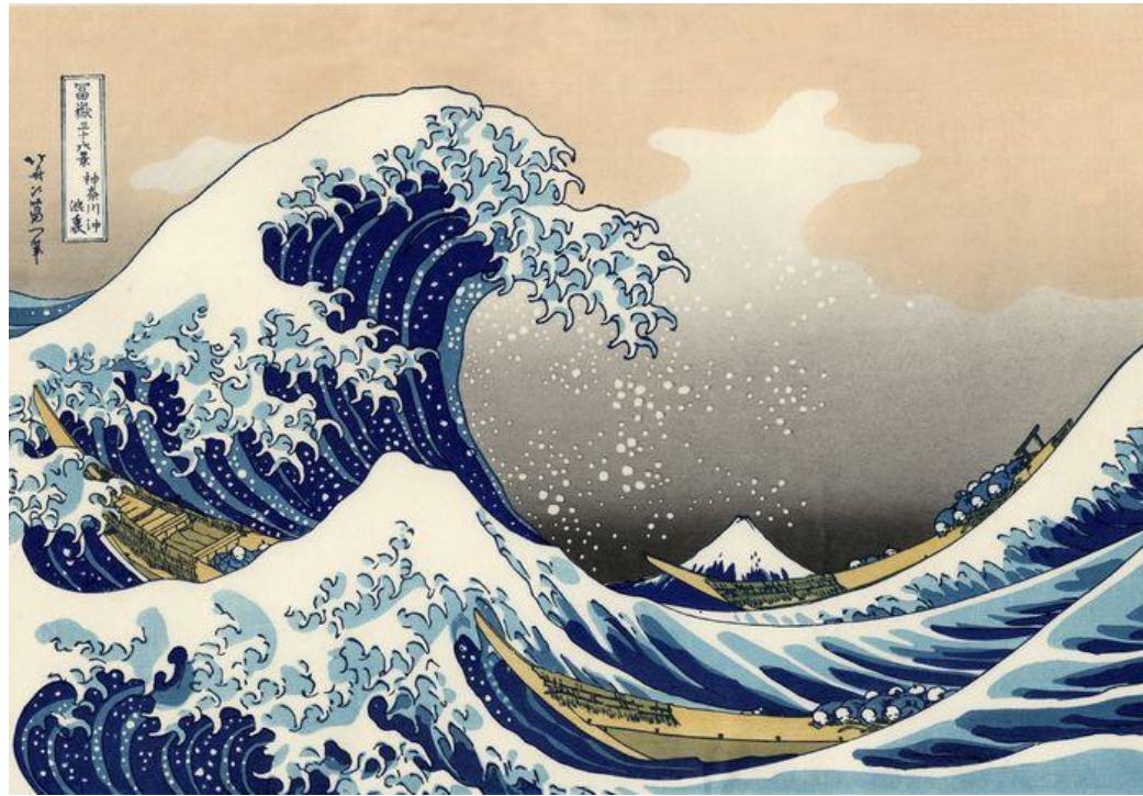
Кацусика Хokusай Большая волна в Канагаве. 1823