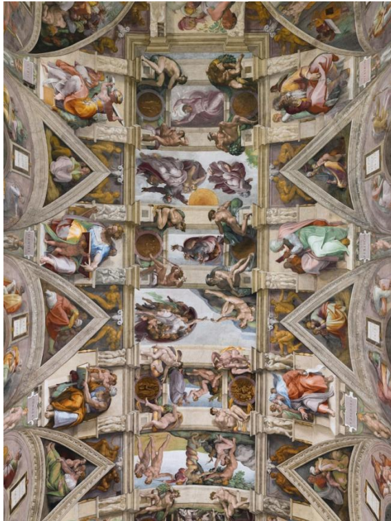
Микеланджело. Сикстинская капелла. 1508–1512