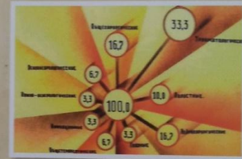
Распределение эвакогоспиталей по специализации