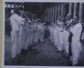
Раненые в руку

Согласно этапности госпитализации, большинство раненых, поступавших в эвакогоспитали глубокого тыла, нуждалось в длительном лечении и сложных, порой уникальных операциях для сохранения их жизни и возвращения в строй. К началу 1942 года в эвакогоспиталях Свердловской области были организованы специализированные отделения – нейрохирургические, челюстно-лицевые, торакальные и полостные, глазные, инфекционные и терапевтические. Тринадцать специализированных коев были травматологическими.