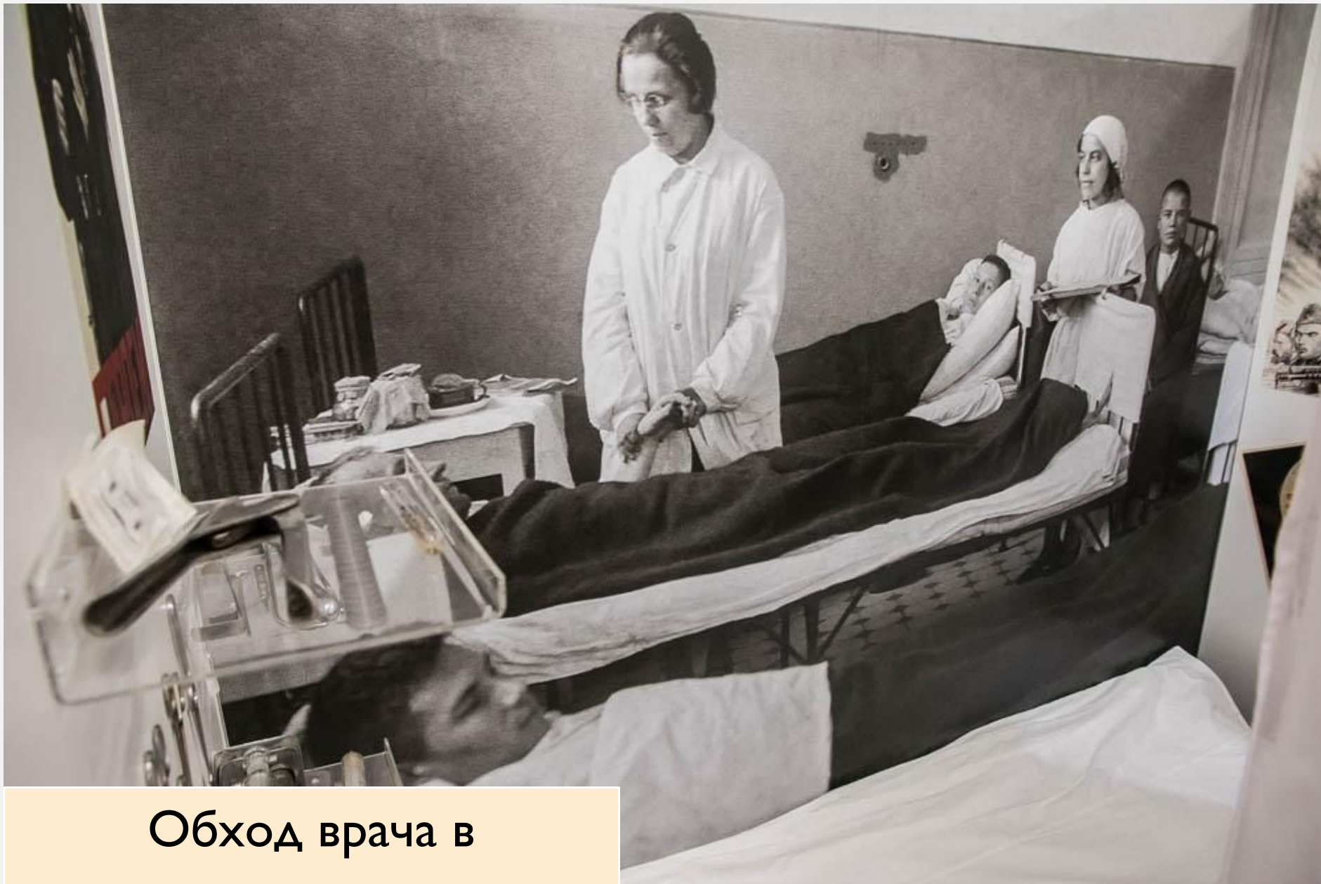
Обход врача в эвакогоспитале