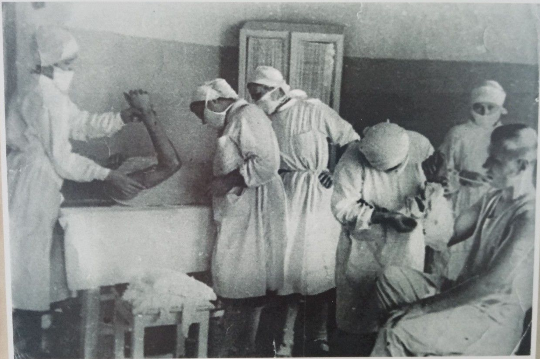
В перевязочной...Работают медсёстры...