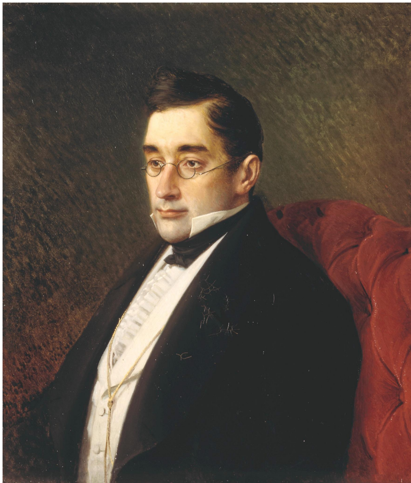
Александр Сергеевич Грибоедов