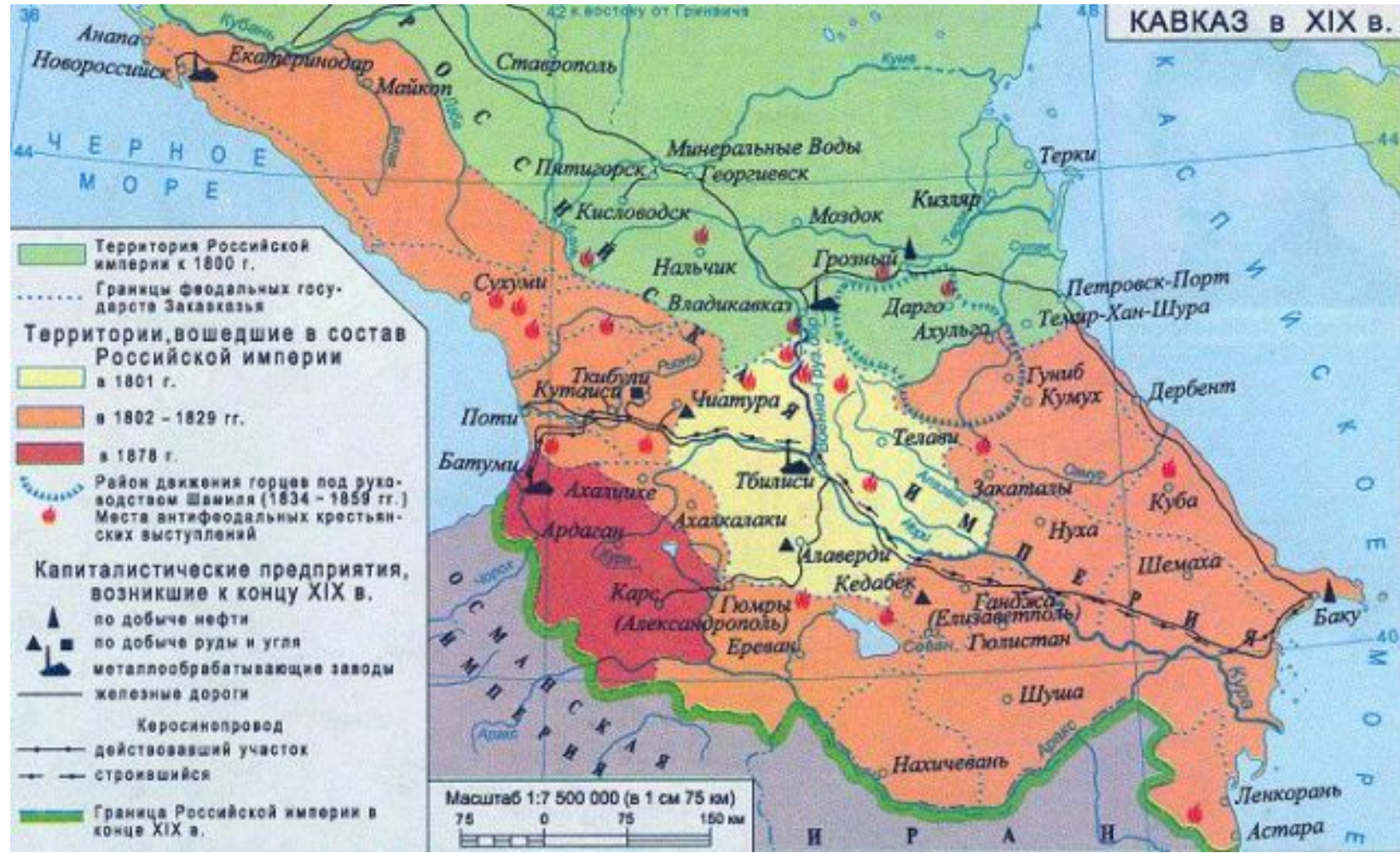
1817-1864 гг. - Кавказская война