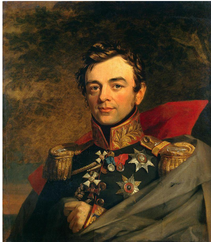
генерал-фельдмаршал Иван Федорович Паскевич