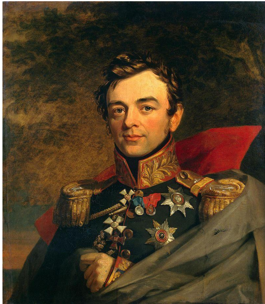
генерал-фельдмаршал Иван Федорович Паскевич