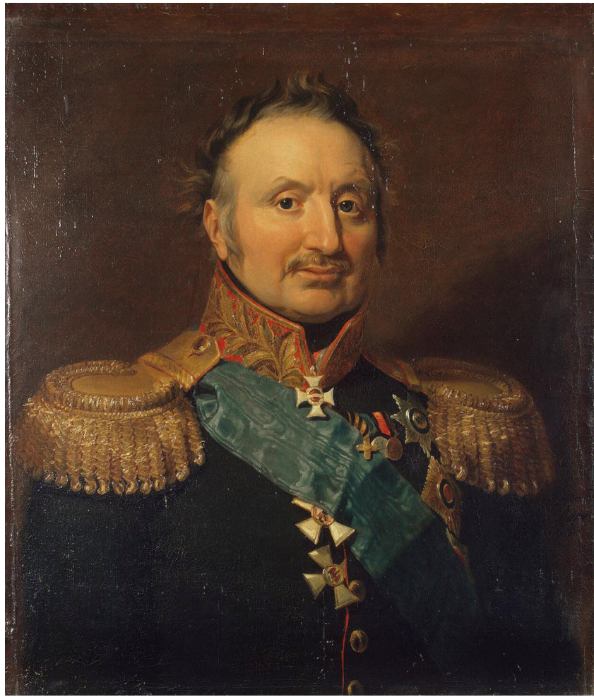
генерал-фельдмаршал Петр Христианович Витгенштейн