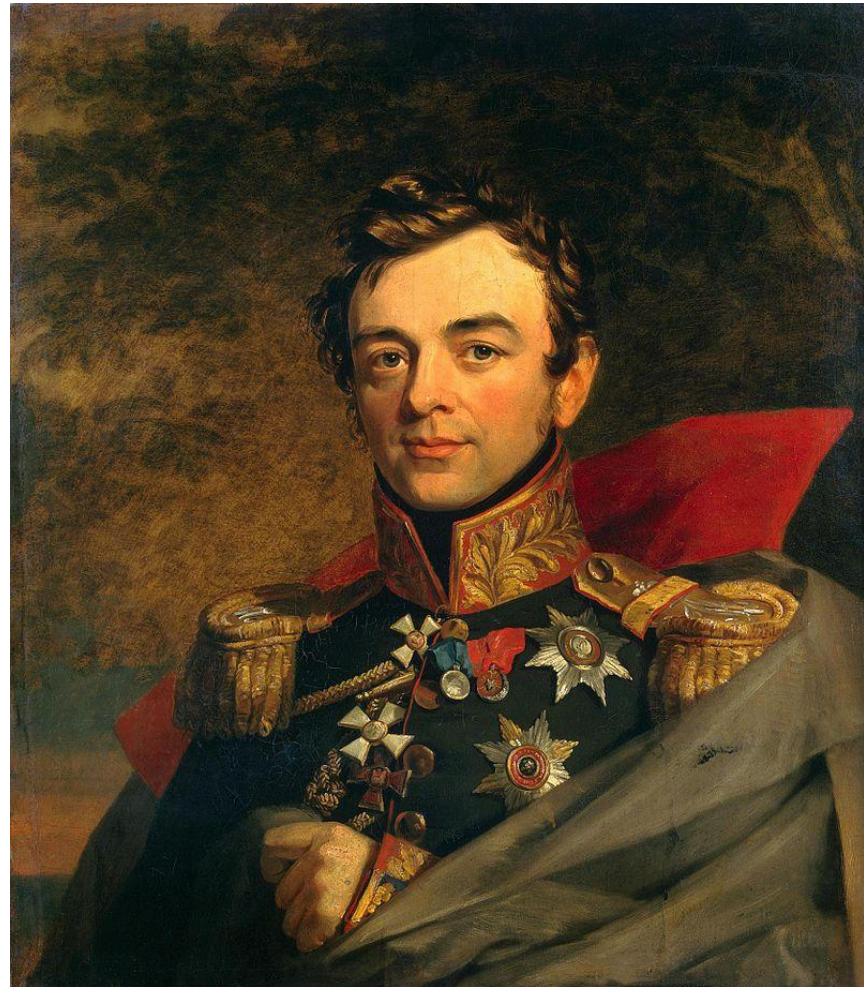
генерал-фельдмаршал Иван Федорович Паскевич