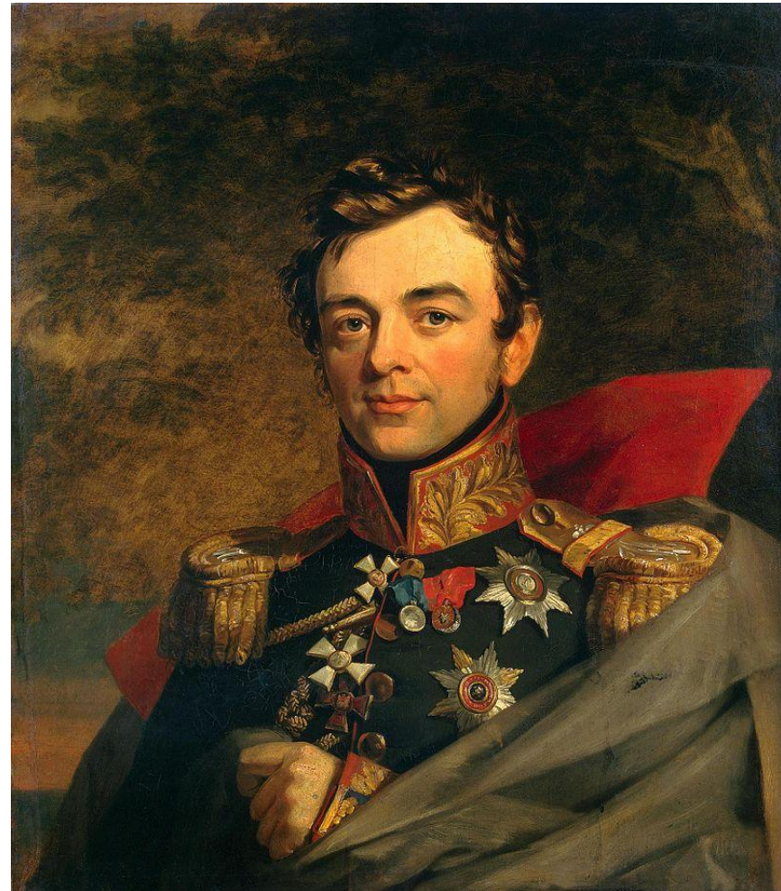
генерал-фельдмаршал Иван Федорович Паскевич