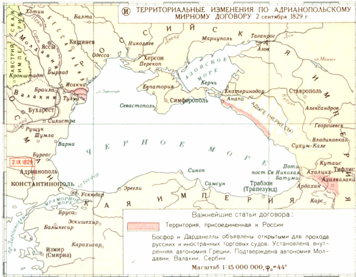
1828-1829 гг. - русско-турецкая война