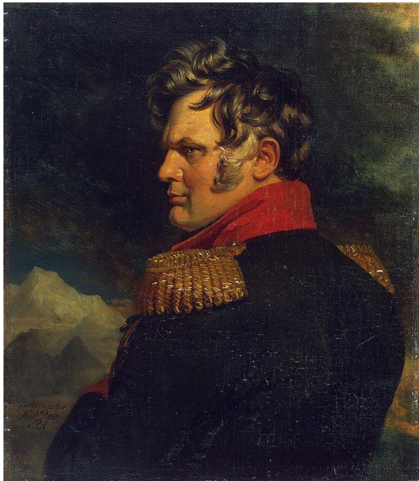
генерал Алексей Петрович Ермолов