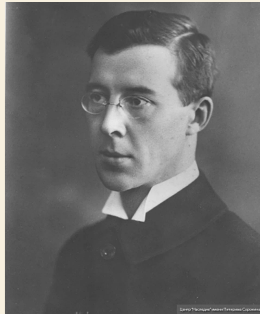
Центр "Наследие" имени Питериса Сорокина