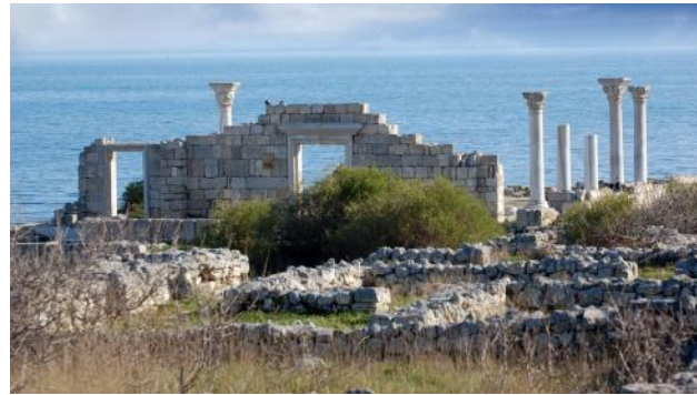
Руины Херсонеса – древнегреческой колонии в Крыму

ПОЛИТИЧЕСКИЕ – связаны с управлением полисом