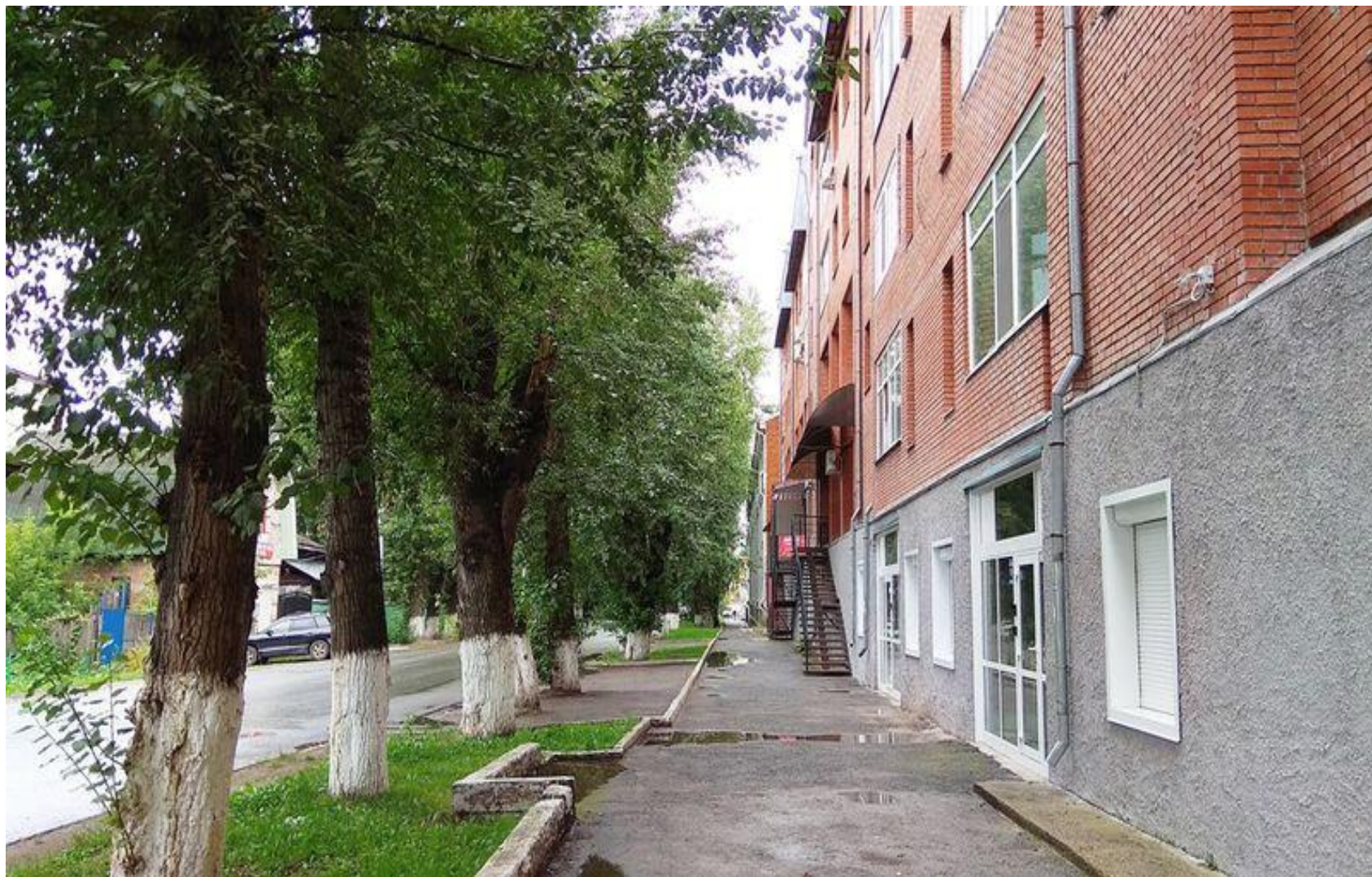
Тополлиная аллея у дома ул Советская 84