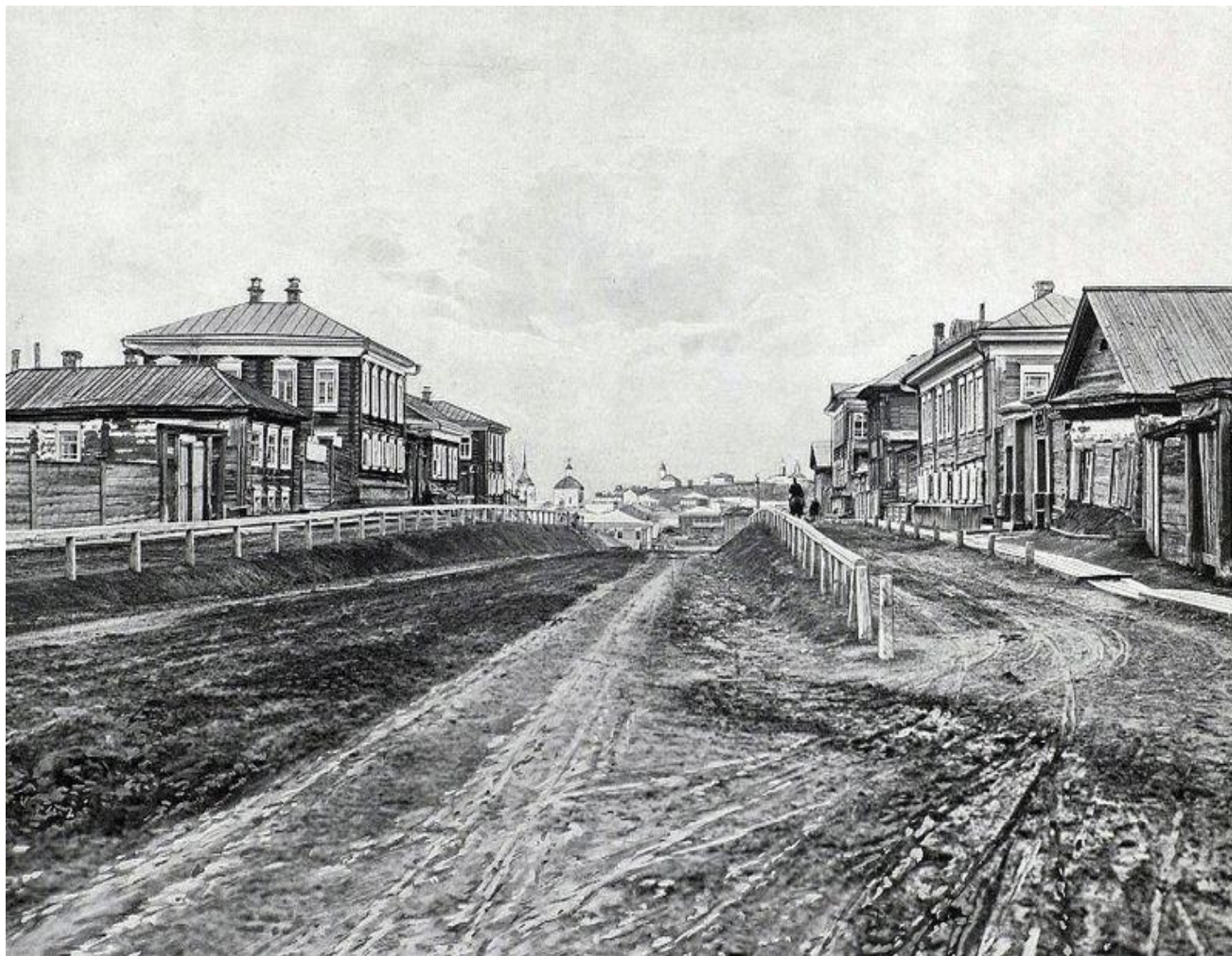
Вид на улицу Спасскую в распутицу весны 1899 года (ныне это место — вид от перекрёстка пер. Плеханова и ул. Советской вниз к площади)