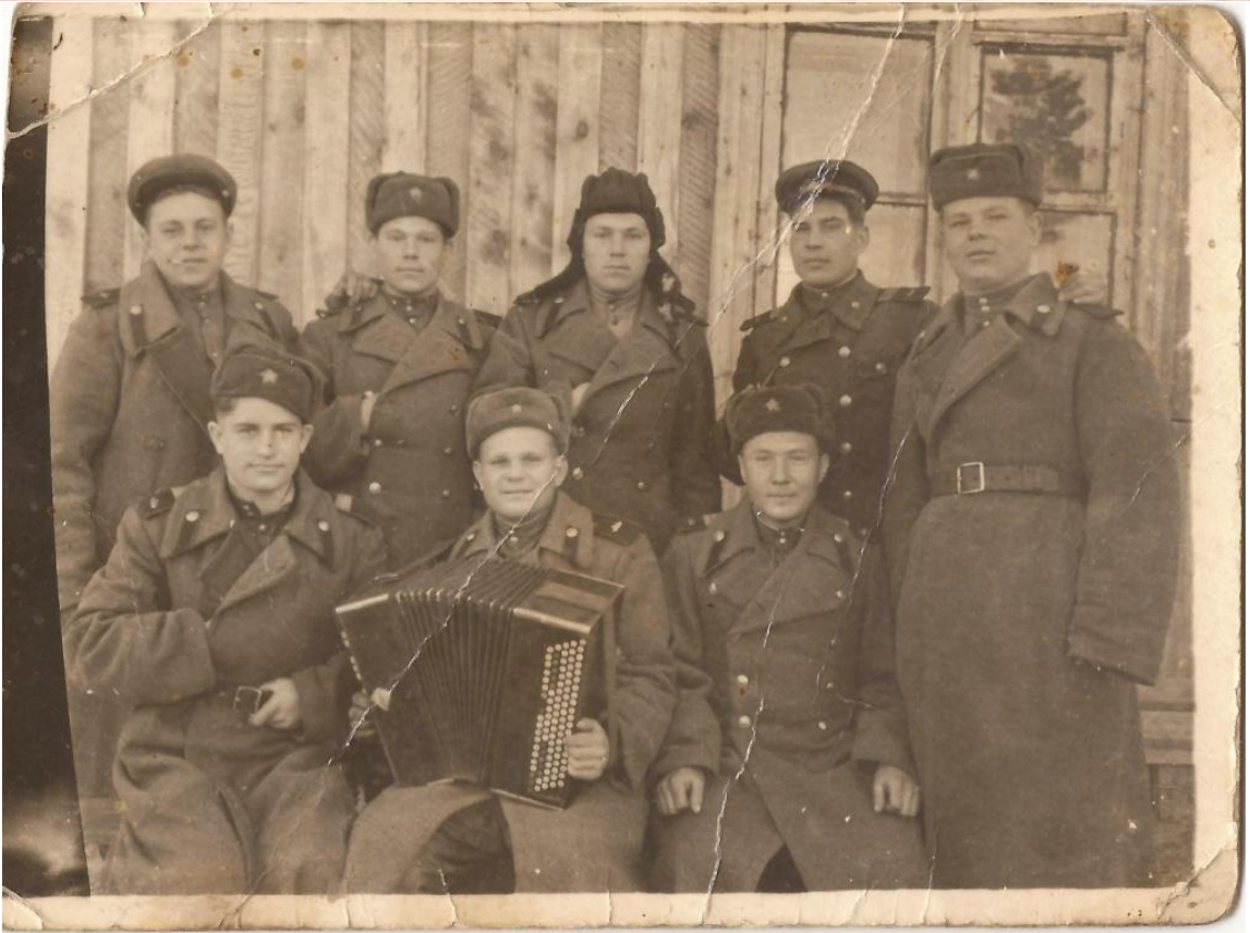
На родину вернулся в 1950 году, в звании ефрейтора.