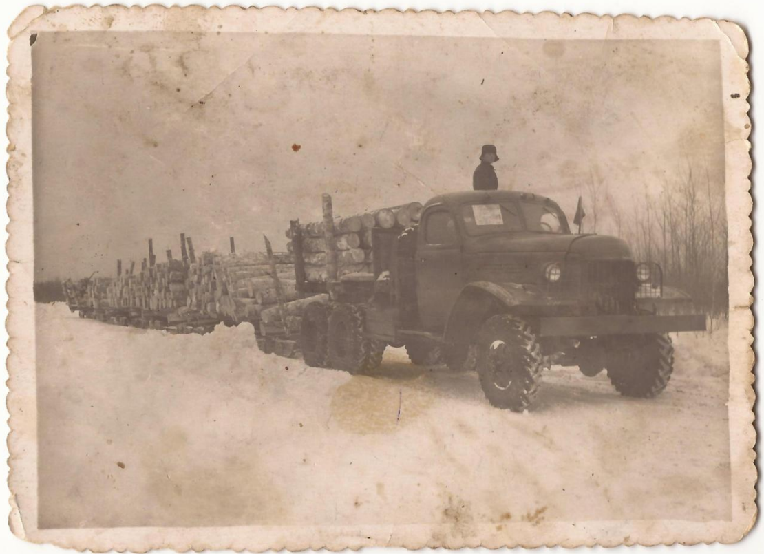
После войны работал в леспромхозе водителем (права водителя получил на войне)