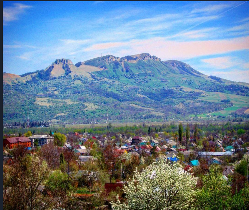
Псебай Краснодарского края(ранняя весна)

6 сентября 1962 года Александр Иванович Гераськин скончался от фронтовых ран. Похоронен в посёлке Псебай Краснодарского края.