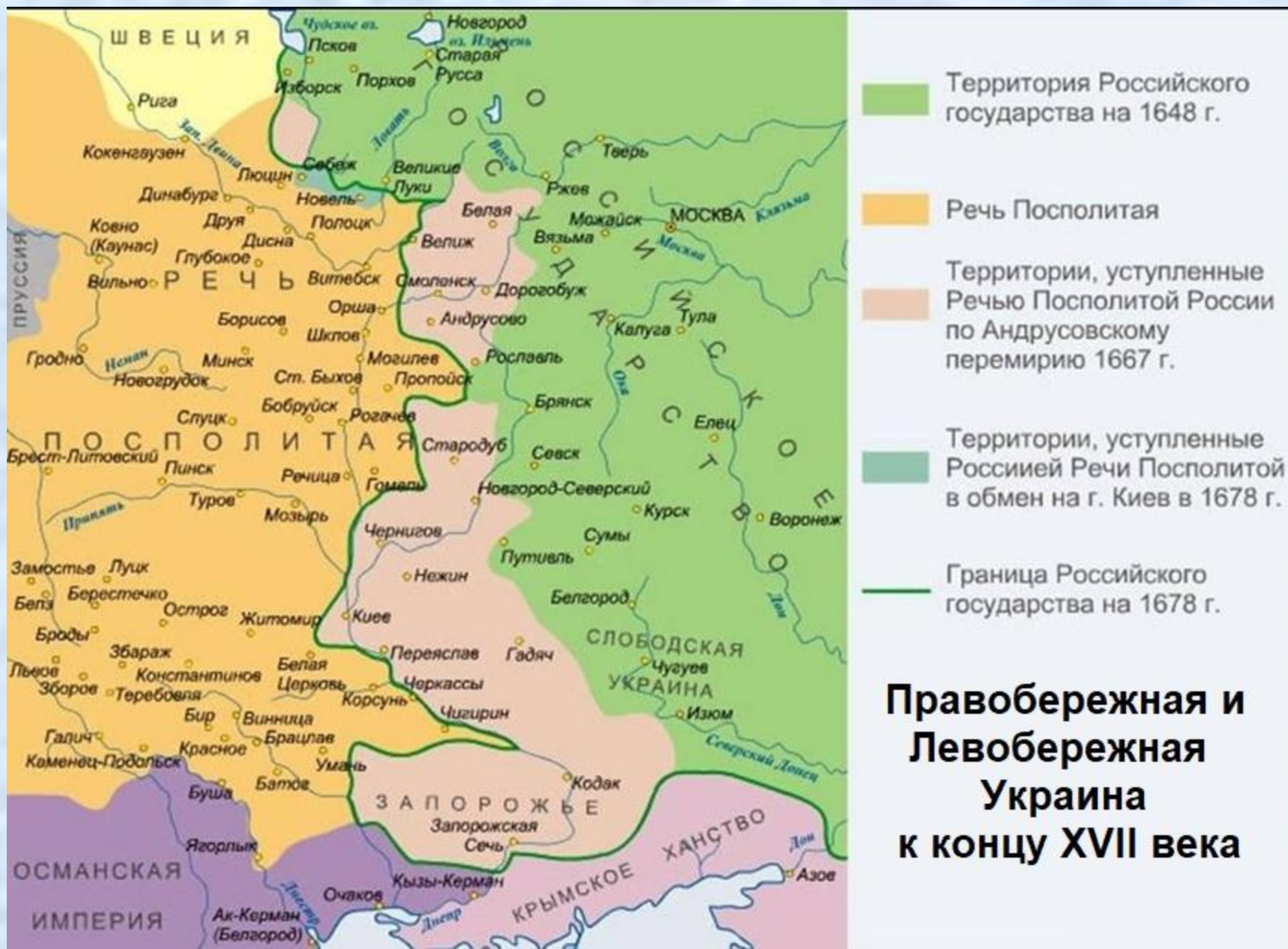
Правобережная и Левобережная Украина к концу XVII века