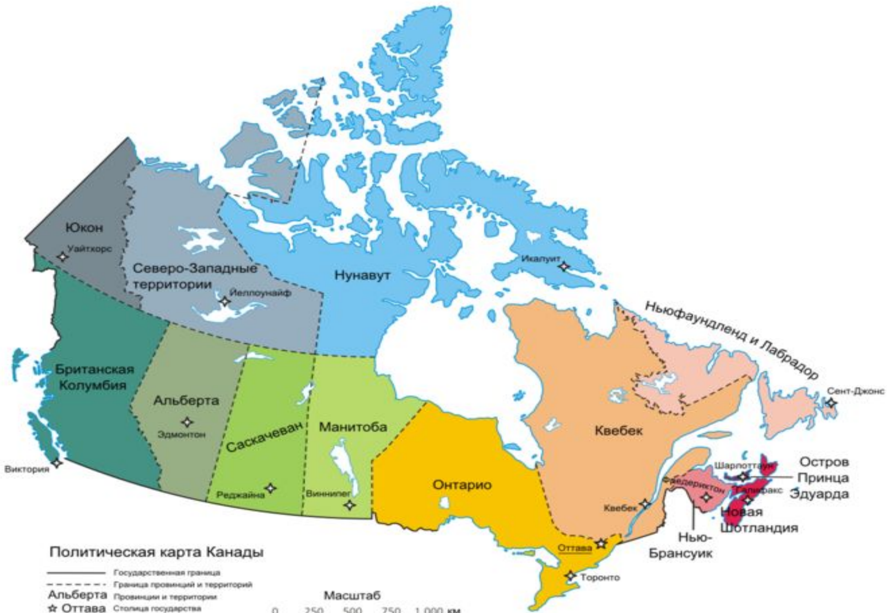
Политическая карта Канады