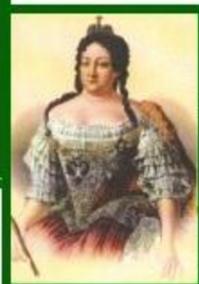
Анна Иоанновна 1730-1740