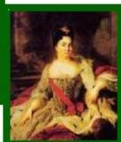
Екатерина I 1725-1727