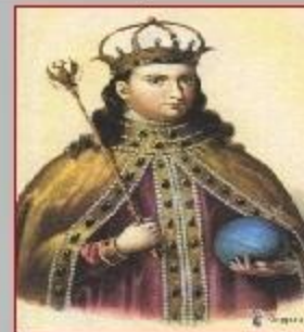
Царевна Софья Алексеевна (1682-1689)