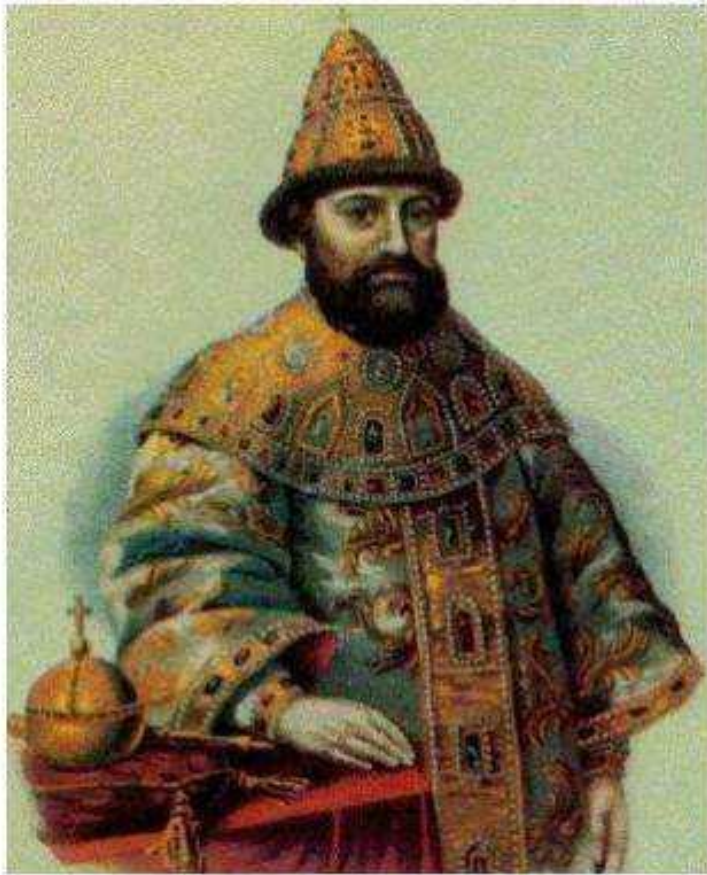
Михаил Федорович Романов