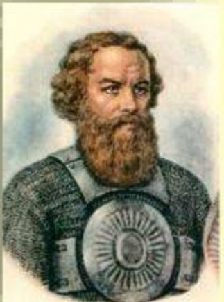
Князь Дмитрий Трубецкой Князь Дмитрий Михайлович Пожарский Кузьма Минин