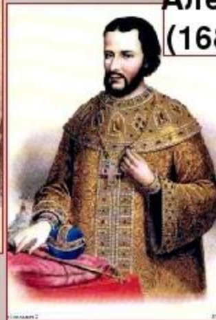
Иван Алексеевич Романов (1682-1696)