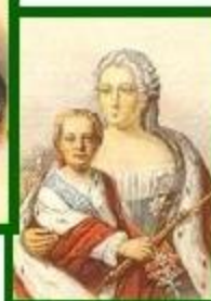
Иван VI Антонович и Анна Леопольдовна 1740-1741