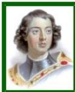
Петр I 1682-1725

Период в истории России с 1725 по 1762 г.