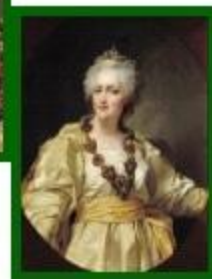
Екатерина II 1762-1796