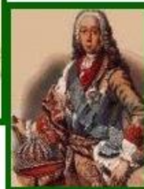
Петр III 1761-1762