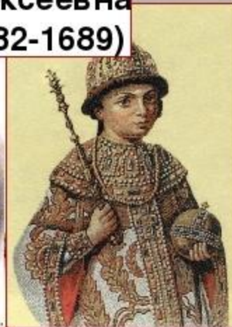
Петр Алексеевич Романов (1682-1725)