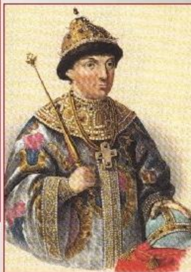
Федор Алексеевич Романов (1676-1682)