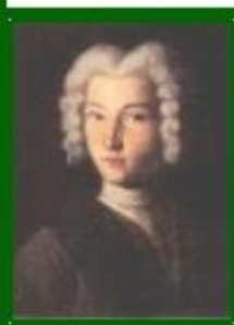
Петр II 1727-1730