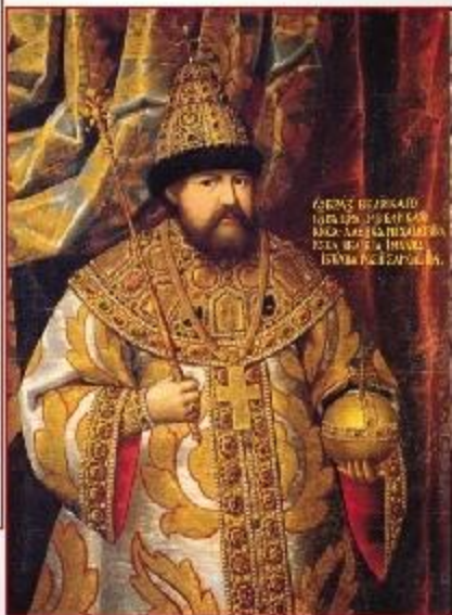
Алексей Михайлович Романов (1645-1676)