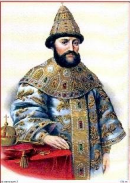
Михаил Федорович Романов (1613-1645)