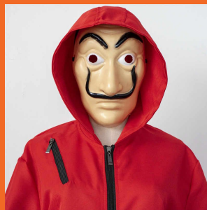
达利的面具 Маска Дали