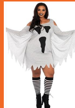
幽灵 Привидение, призрак