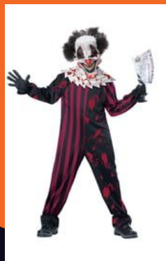
丑角 chǒujiǎo клоун