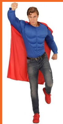
超级英雄 chāojí yīngxióng супергерой