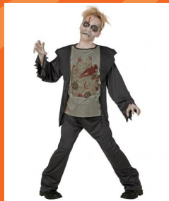
丧尸 sāngshǐ зомби

Остальные участники должны догадаться, что это за костюм.