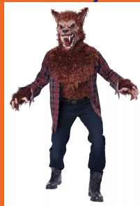
狼人 láng rén оборотень