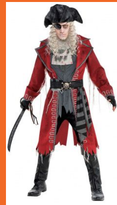
海盗 hǎidào пират