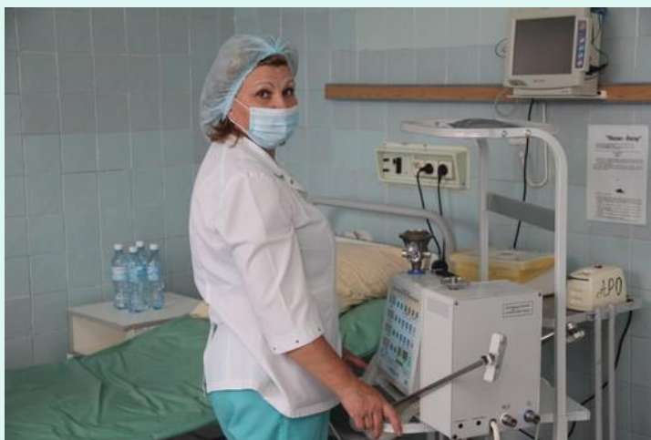
отделение анестезиологии и реаниматологии