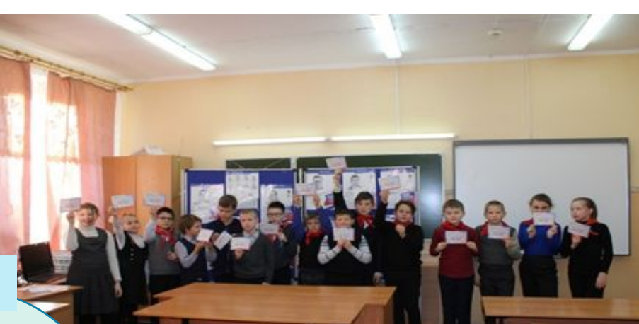
ДЕНЬ ГЕРОЕВ ОТЕЧЕСТВА