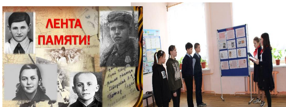
ДЕНЬ ЮНОГО ГЕРОЯ- АНТИФАШИСТА