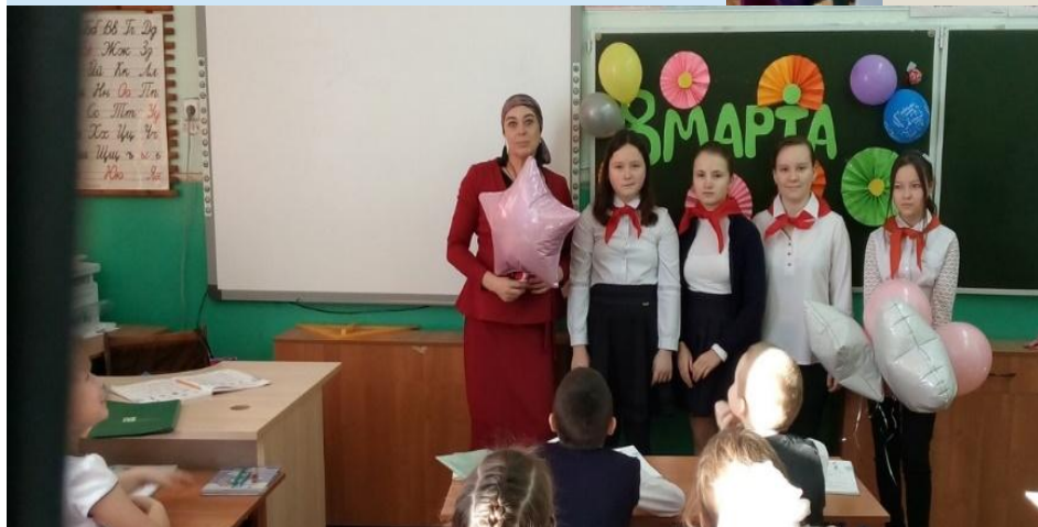
О САМЫХ БЛИЗКИХ