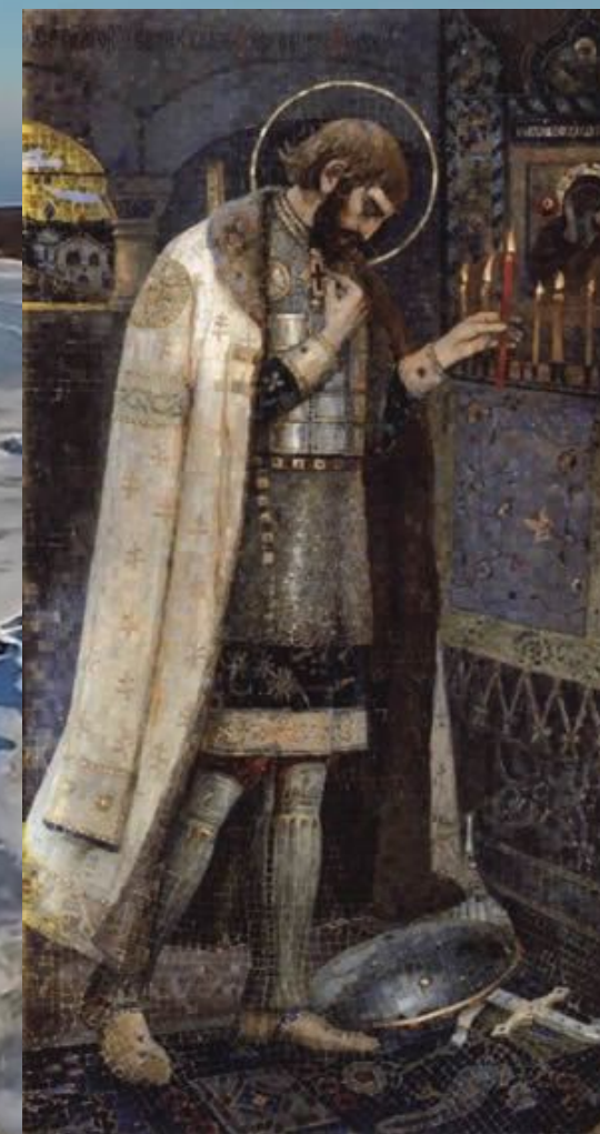
Нестеров М.В. Святой Александр Невский