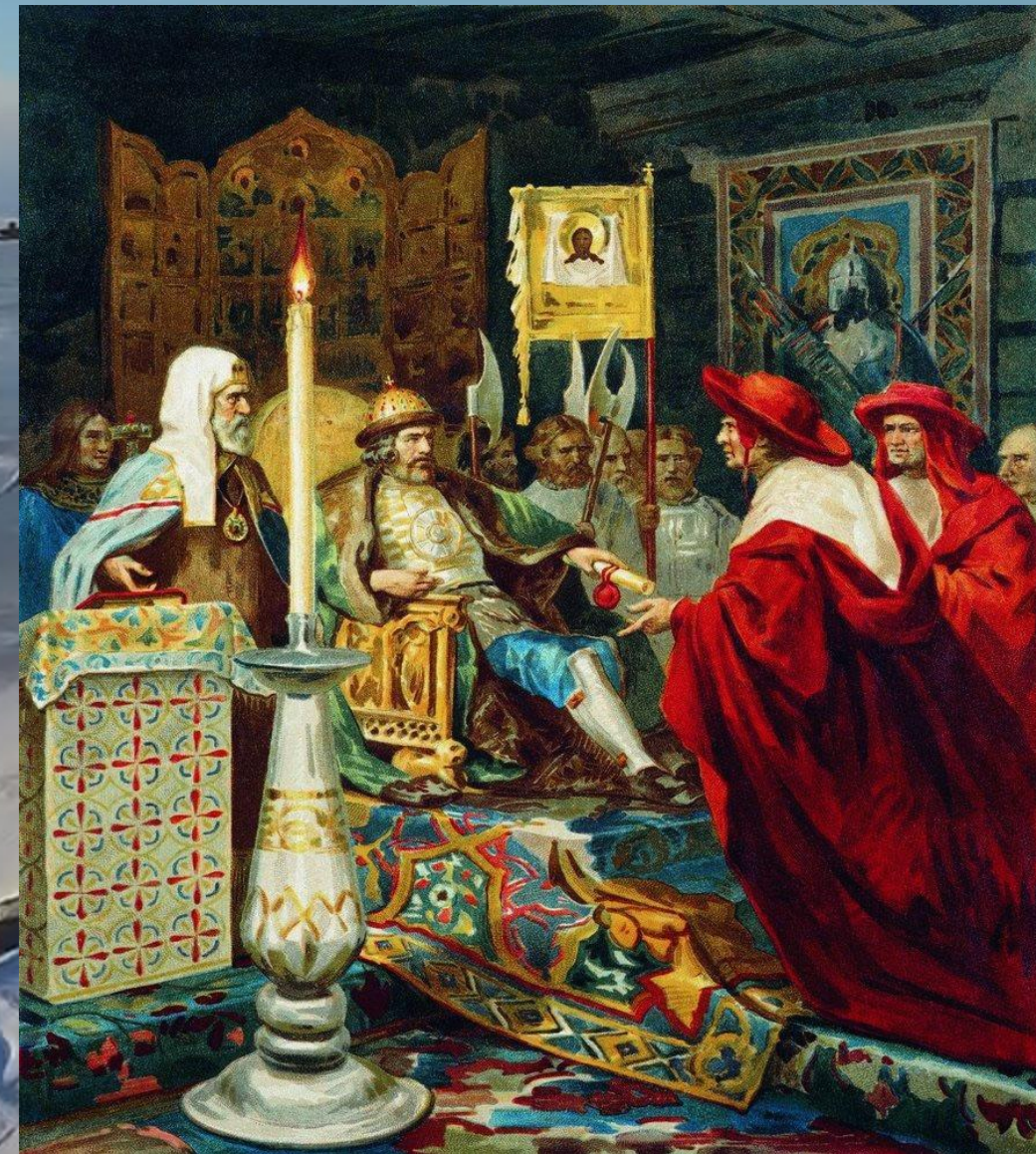
Гених Семирадский «Александр Невский принимает папских легатов»