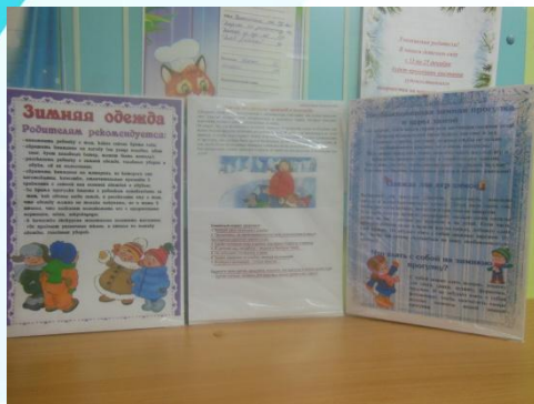
Информация для родителей