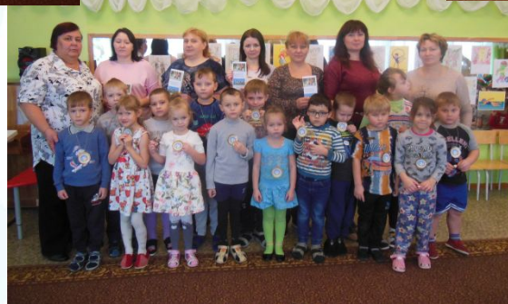
Семейный досуг «Мы здоровью скажем «Да!»»